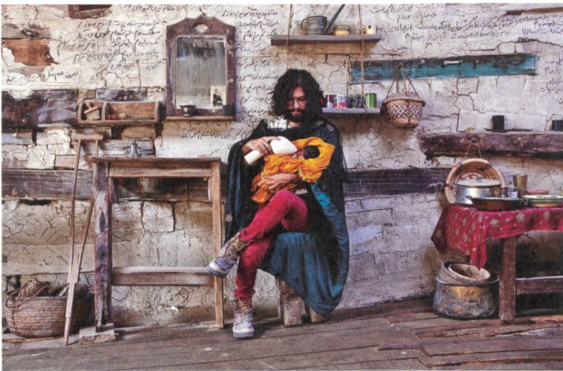
A Dragon Arrives! Regie: Mani Haghighi