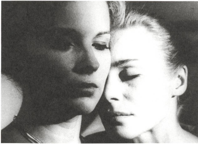
Tystnaden / Das Schweigen (1963) Regie: Ingmar Bergman