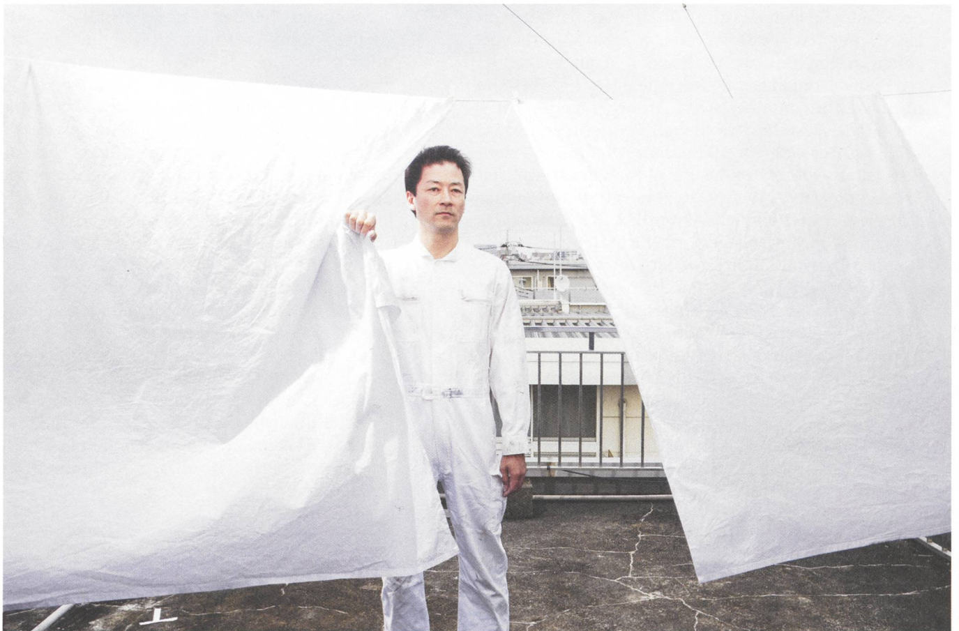
Harmonium Freund oder Feind?