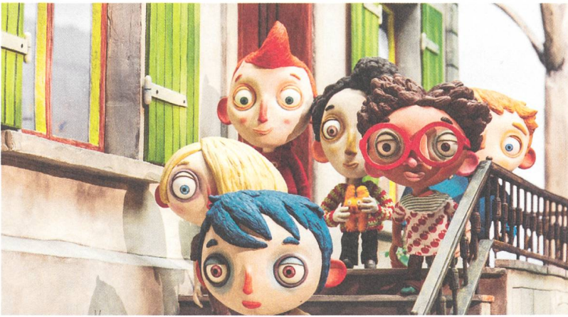
Ma vie de Courgette Untereinander finden die Waisenkinder Halt