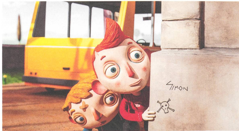
Ma vie de Courgette Drei Sekunden Animation pro Tag