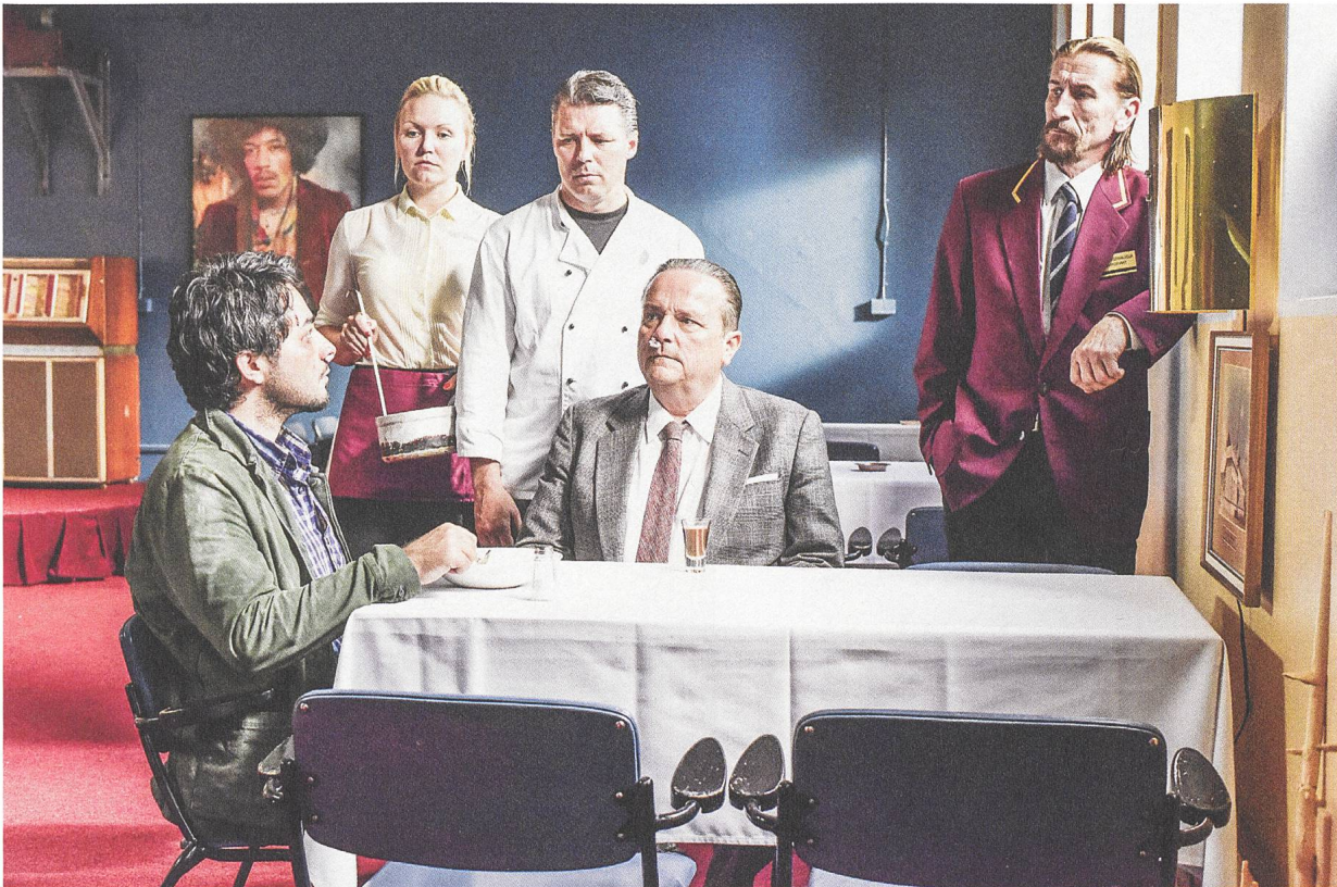
The Other Side of Hope Regie: Aki Kaurismäki