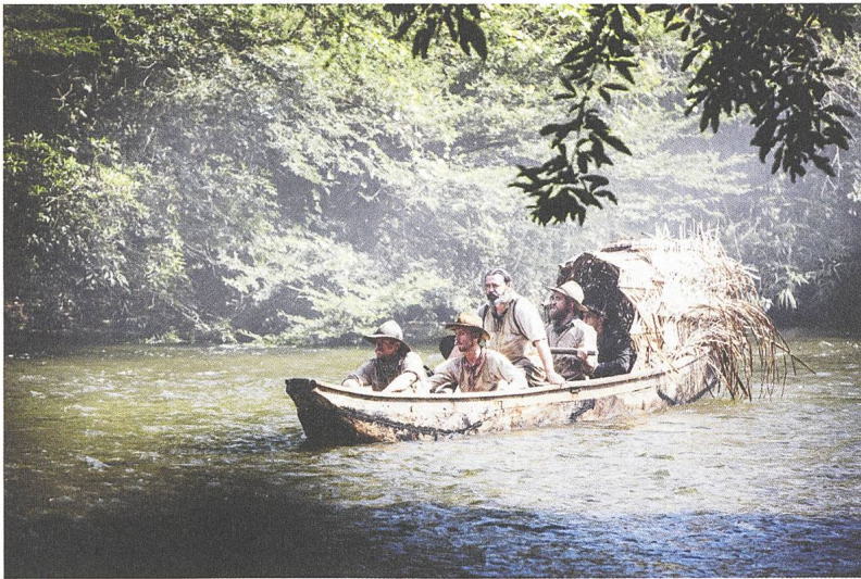
The Lost City of Z Regie: James Gray