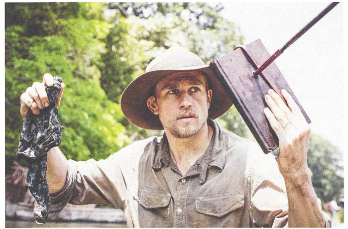
The Lost City of Z Charlie Hunnam