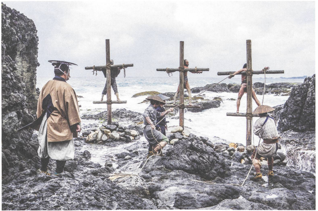
Silence Regie: Martin Scorsese