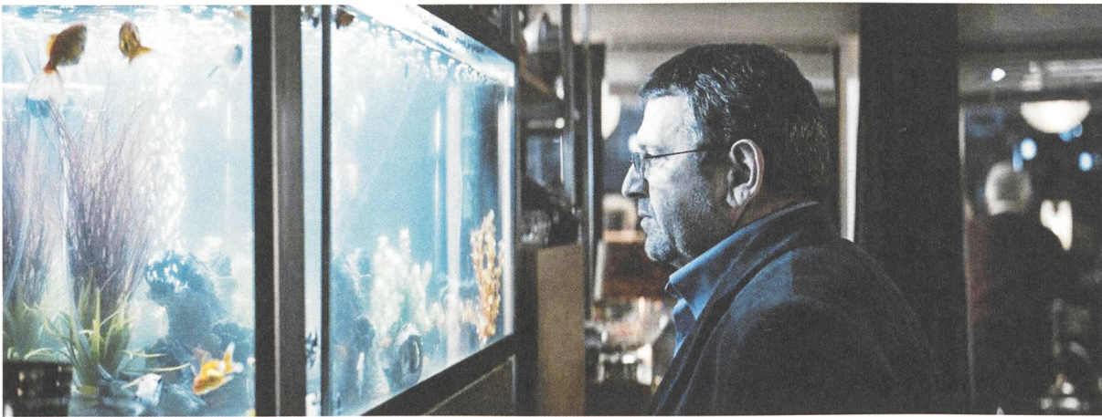
Bacalaureat Regie: Cristian Mungiu