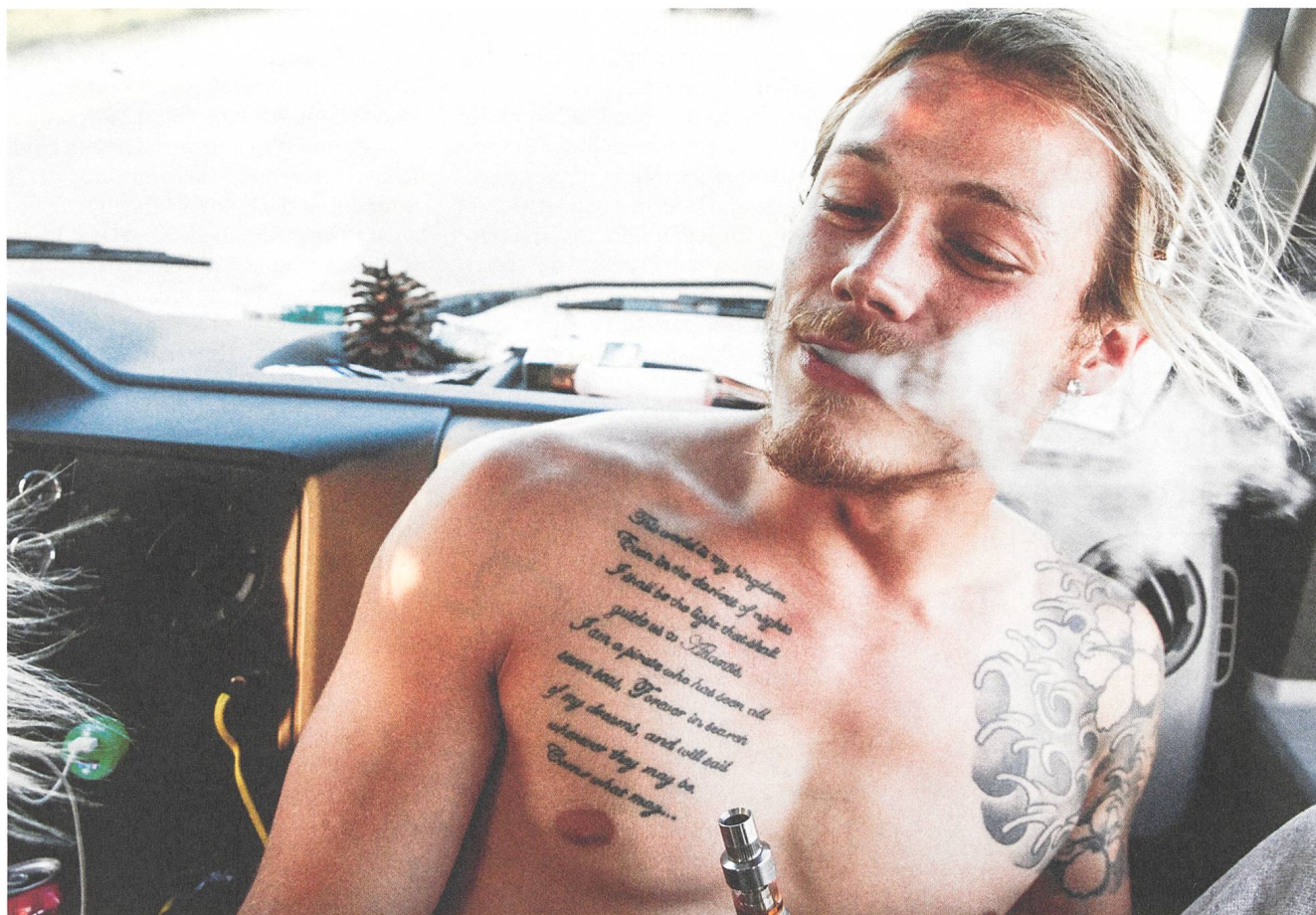
American Honey (2016) Regie: Andrea Arnold

Filmbulletin Diensterstrasse 16, CH-8004 Zürich +41 52 226 05 55 info@filmbulletin.ch www.filmbulletin.ch