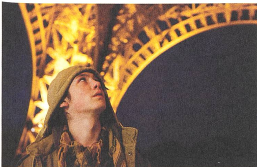
Vincent Beinah-Selbstmord vor perfekter Kulisse