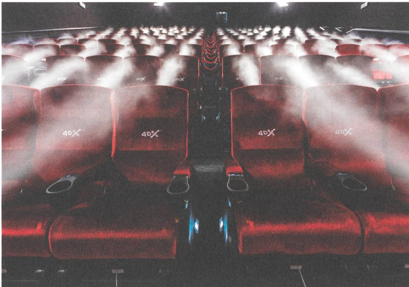
4DX Technik im Kinossessel, von Dunst bis Wind