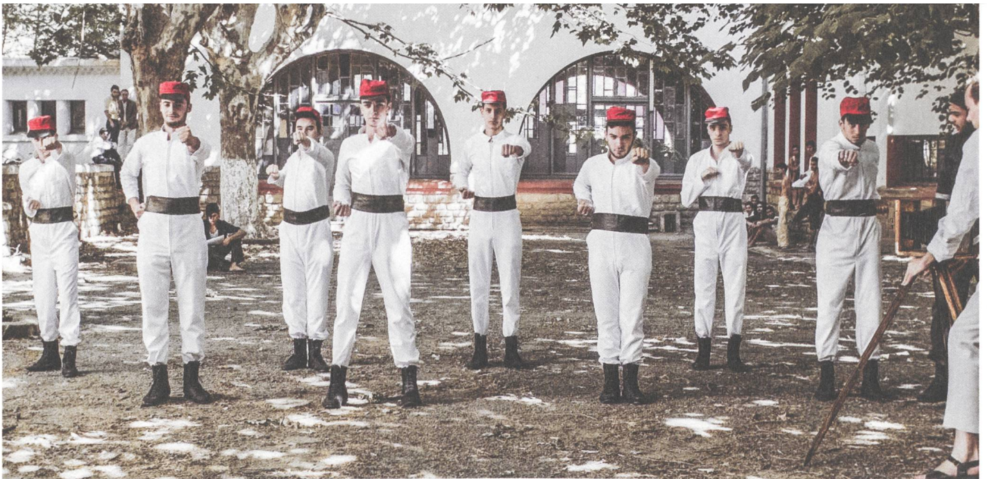
Le fort des fous Regie: Narimane Mari

Wir leben in einer sehr aufregenden Zeit. Und die Entwicklung kann man nicht einfach in einem Schwarz-Weiss-Schema sehen. Netflix produziert grosse Kisten und gibt gleichzeitig unabhängigen Filmemachern viel Geld, zum Beispiel Bong Joon-ho für Okja . Manchmal kauft Netflix auch kleine Filme, unabhängig davon, welche Reichweite sie haben werden; in diesem Fall geht es um die Diversifizierung des Angebots. Und manchmal akzeptiert Netflix auch einen Kinostart, neben dem Streaming auf der eigenen Plattform. Amazon funktioniert ganz anders. Da braucht es die Kinoauswertung, um die Kundinnen und Kunden zum Streamingangebot zu bringen. Amazon produziert eher Autorenfilme und ist dabei sehr selektiv. Ein grossartiger unabhängiger Film wie Manchester by the Sea hätte es ohne Amazon nie bis zur Oscar-Kampagne geschafft.