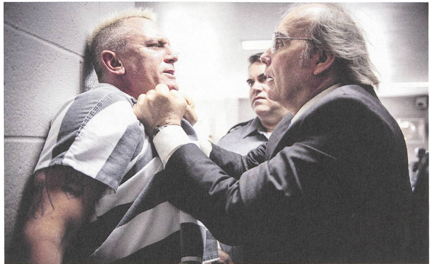
Logan Lucky Daniel Craig und Dwight Yoakam