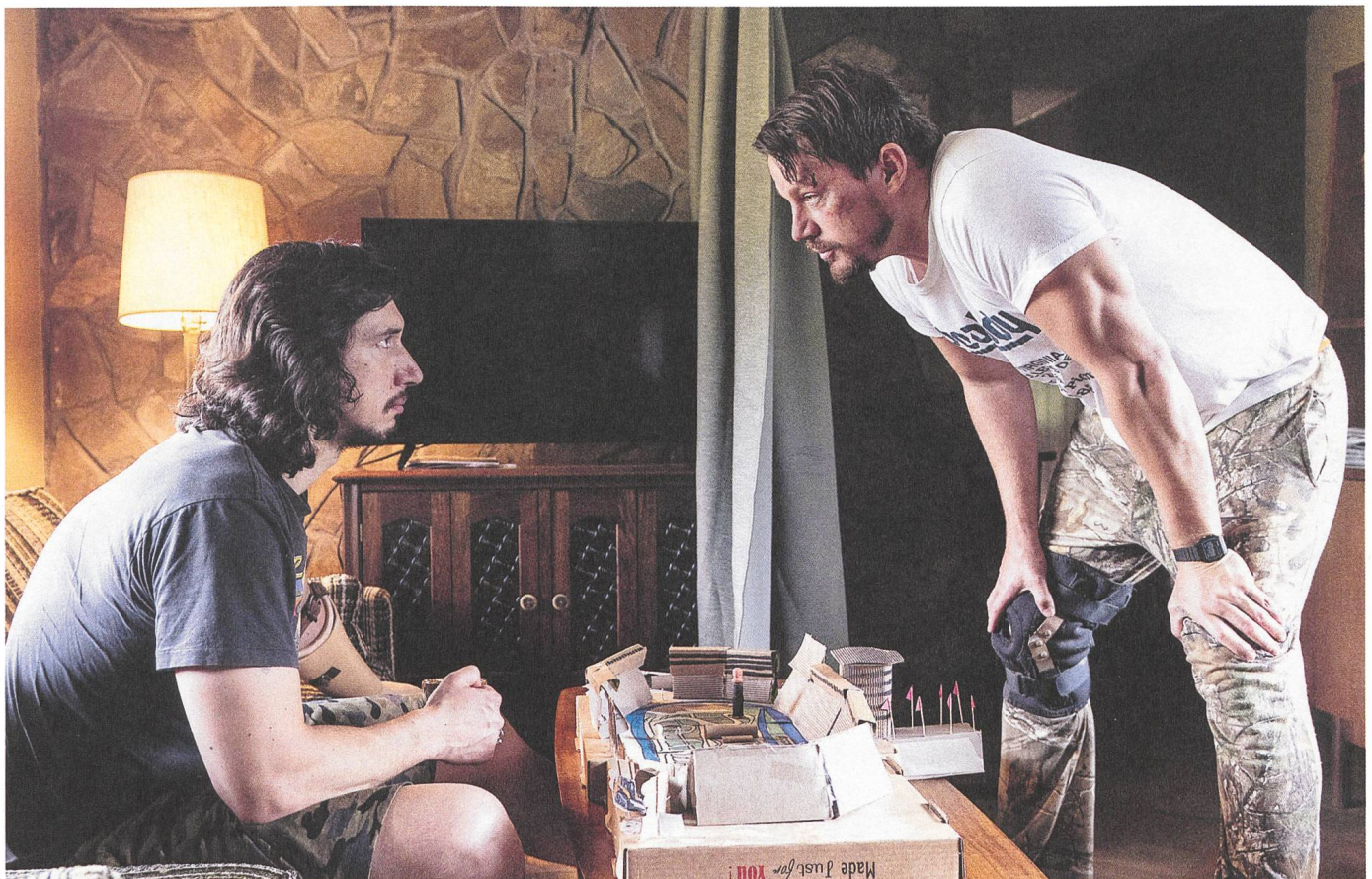
Logan Lucky Adam Driver und Channing Tatum