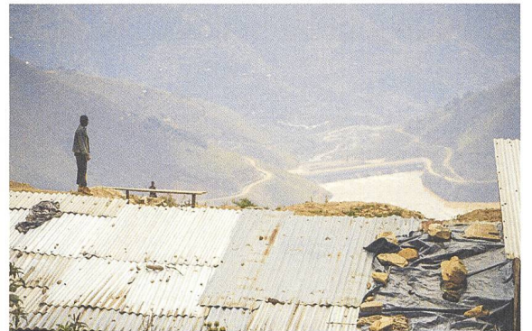
Das Kongo Tribunal