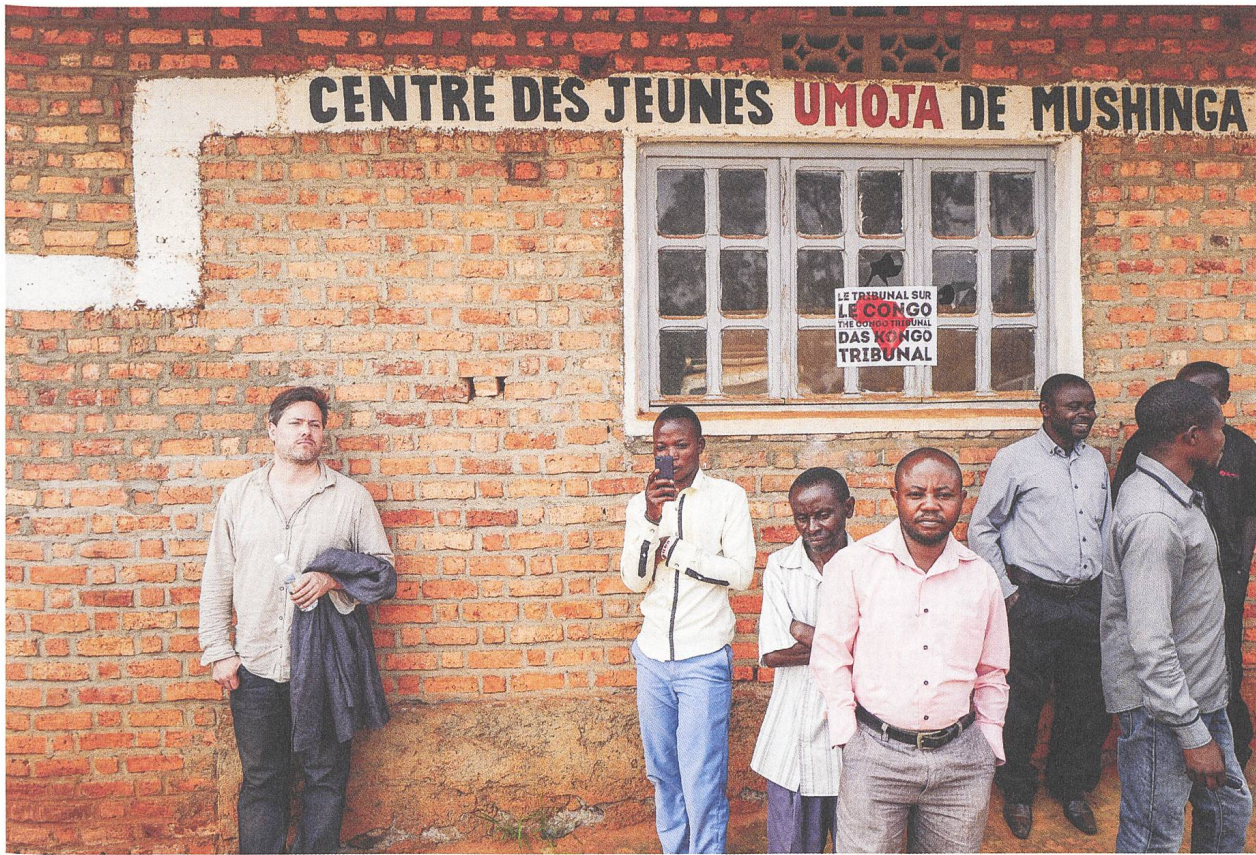
Das Kongo Tribunal Milo Rau, anlässlich der Präsentation seines Films im Dorf Mushinga, Süd-Kivu