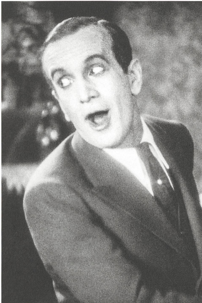
The Jazz Singer (1927) mit Al Jolson