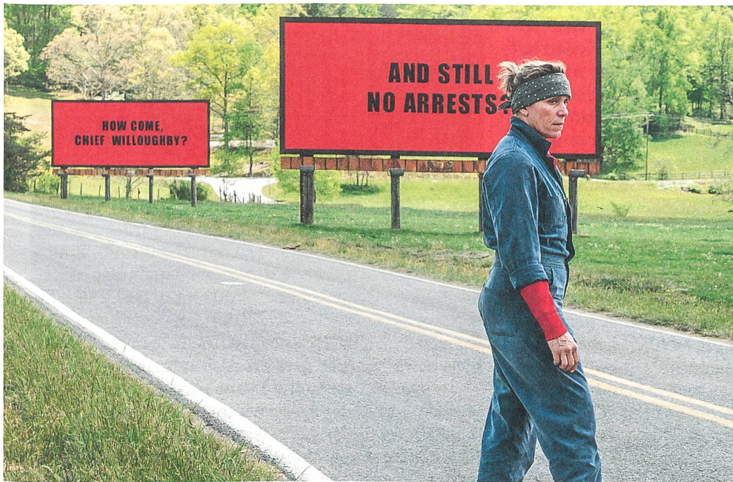
Three Billboards Outside Ebbing, Missouri Regie: Martin McDonagh, mit Frances McDormand