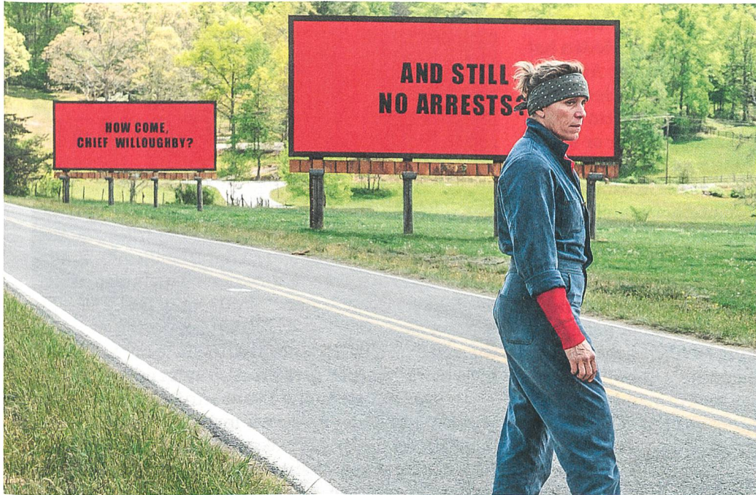
Three Billboards Outside Ebbing, Missouri Regie: Martin McDonagh, mit Frances McDormand