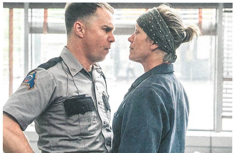
Three Billboards ... Sam Rockwell und Frances McDormand