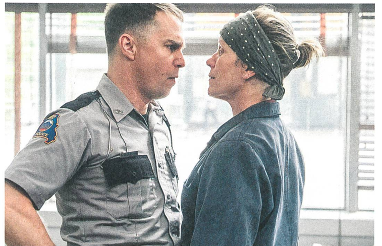
Three Billboards ... Sam Rockwell und Frances McDormand