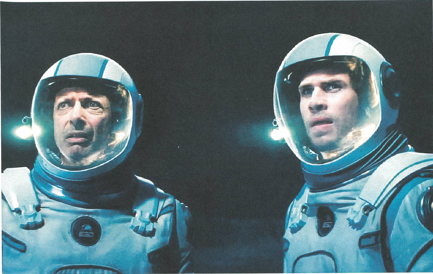
Independence Day: Resurgence (2016) mit Jeff Goldblum und Liam Hemsworth