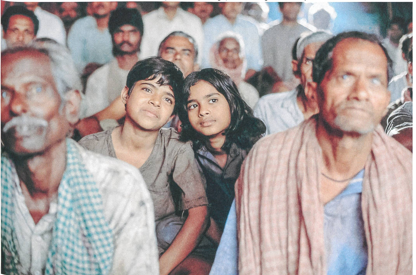
Schatten der Zeit (2004) Regie: Florian Gallenberger, mit Sikandar Agarwal und Tumpa Das