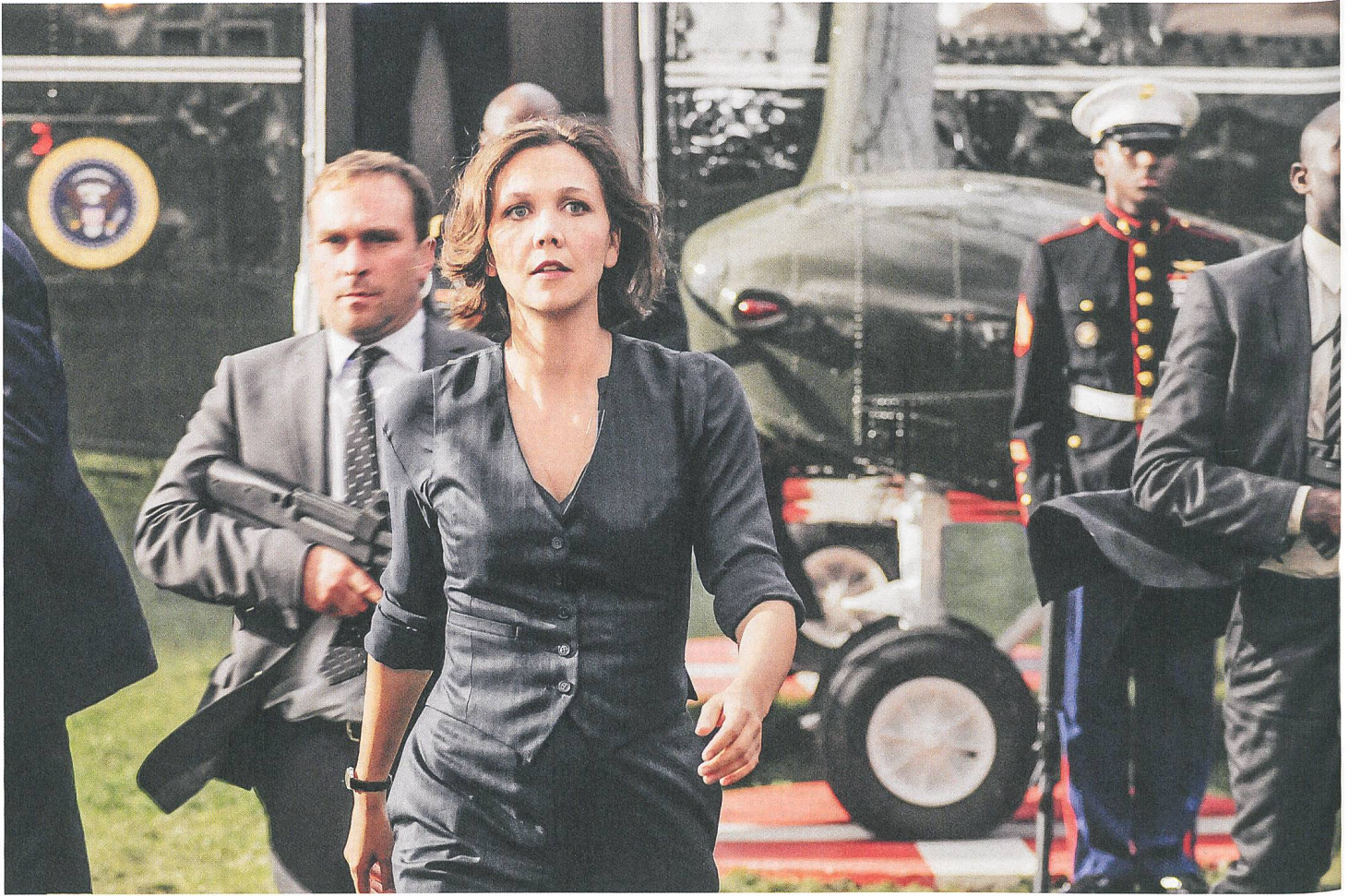
White House Down (2013) mit Maggie Gyllenhaal