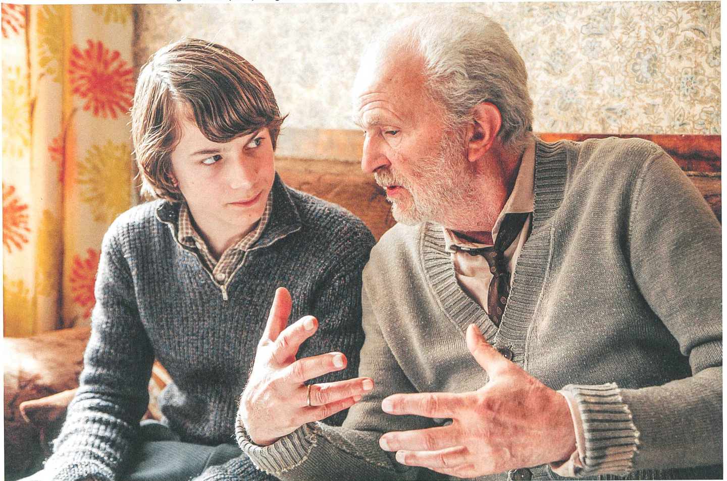
Boxhagener Platz (2010) Regie: Matti Geschonneck, mit Samuel Schneider und Michael Gwisdek