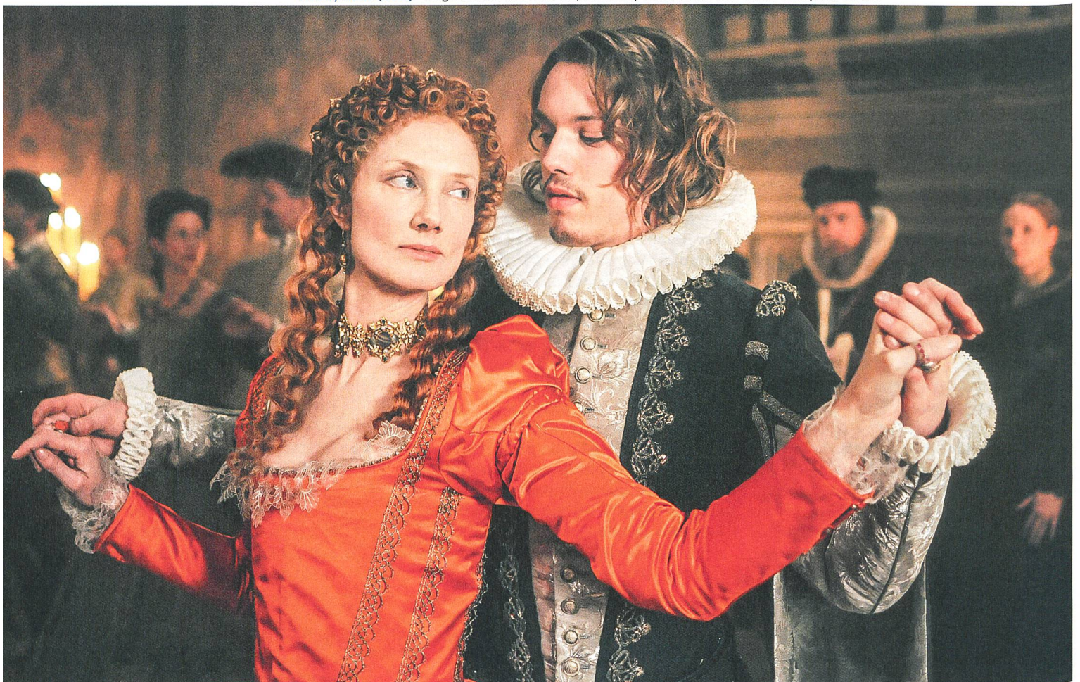
Anonymous (2011) Regie: Roland Emmerich, mit Joely Richardson und Jamie Campbell Bower