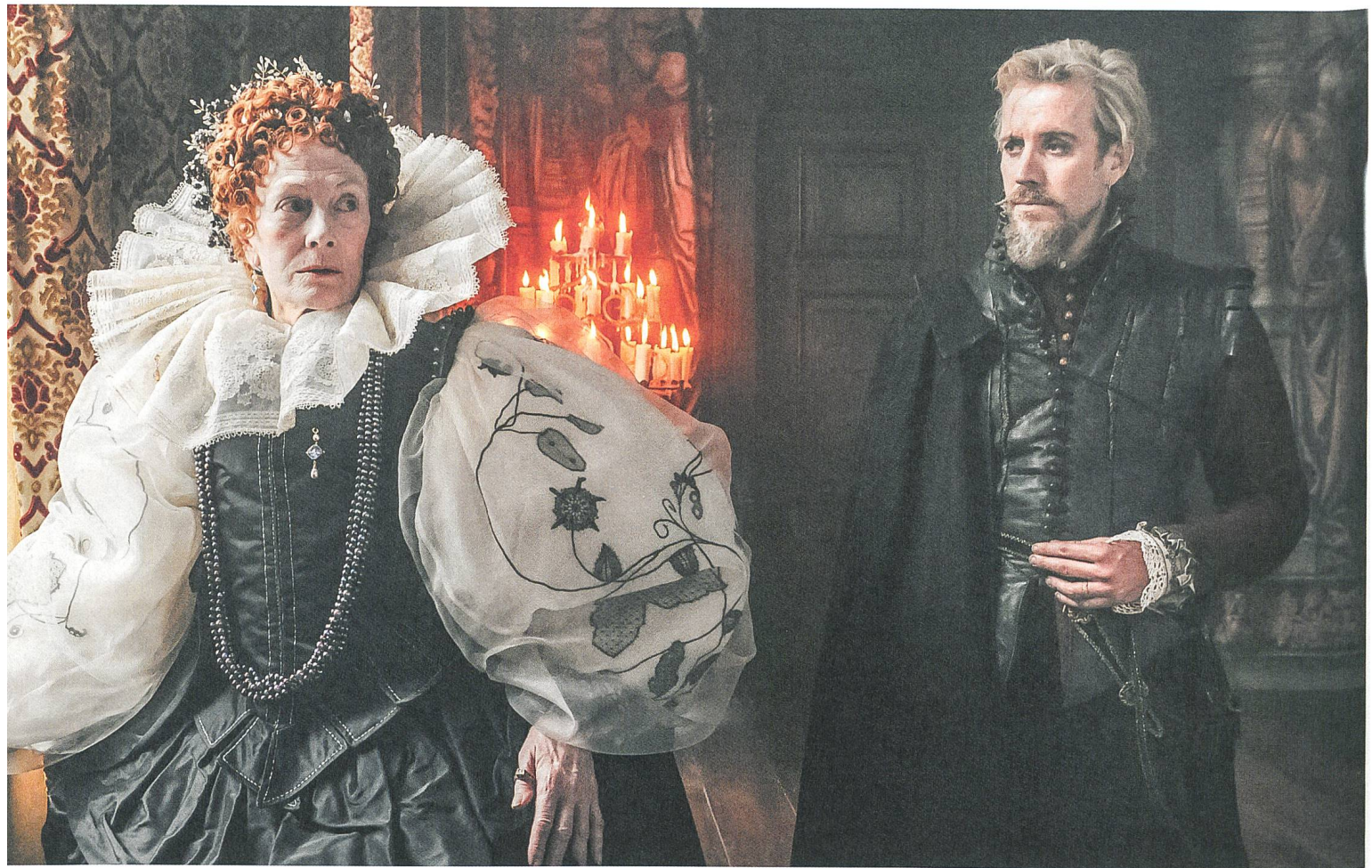
Anonymous (2011) mit Vanessa Redgrave und Rhys Ifans