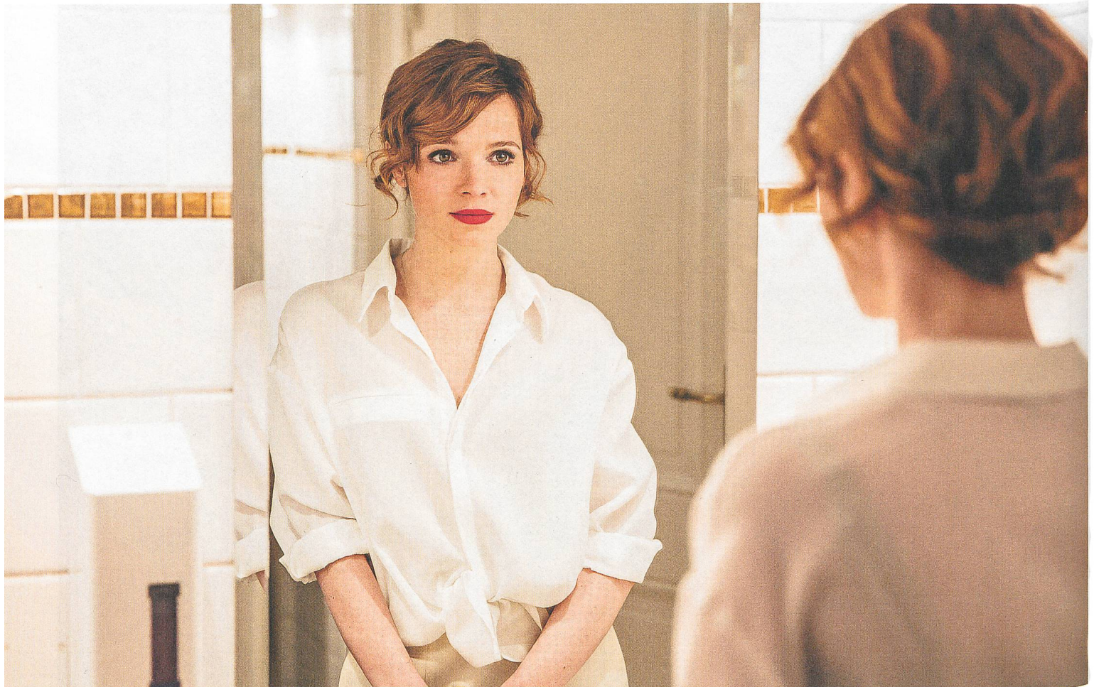
SMS für dich (2016) Regie und Hauptdarstellerin: Karoline Herfurth