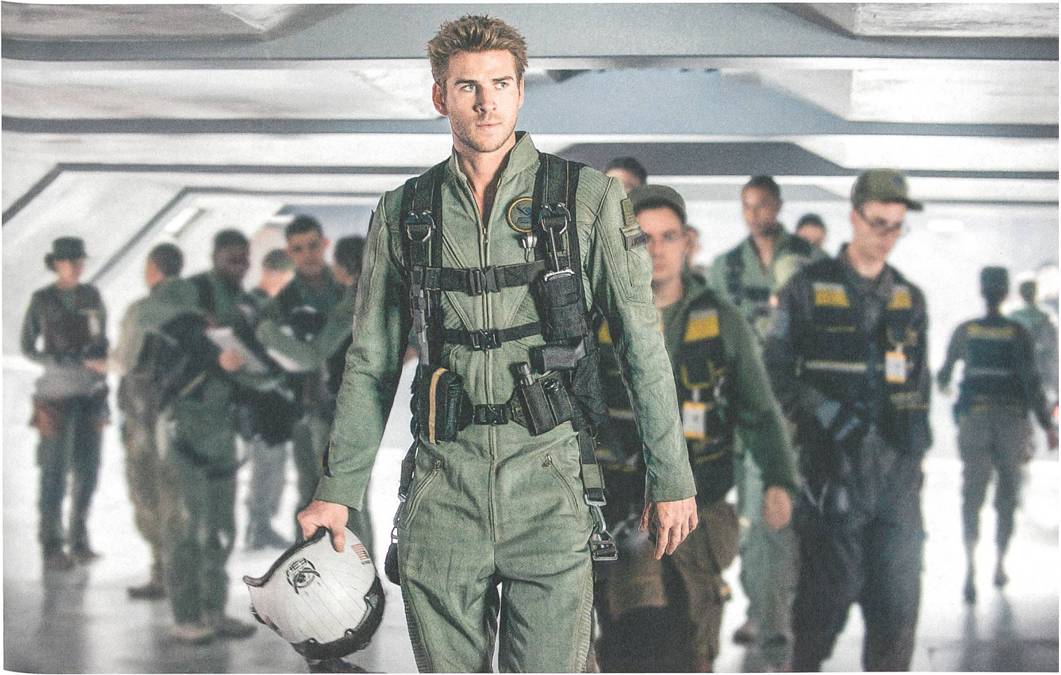
Independence Day: Resurgence (2016) Regie: Roland Emmerich, mit Liam Hemsworth