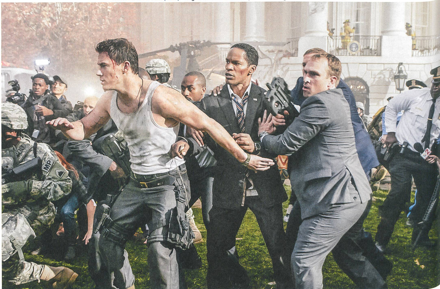
White House Down (2013) Regie: Roland Emmerich, mit Channing Tatum und Jamie Foxx