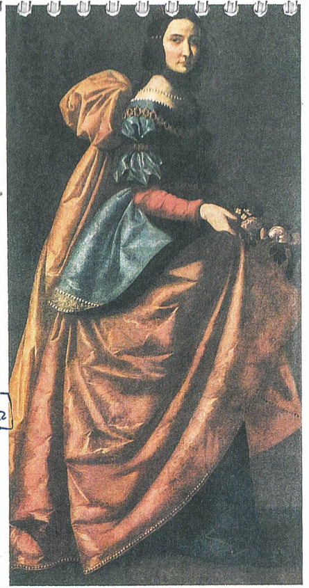
KOSTÜM TAG 17 56 RICHMOND PALACE/A NEARBY FOREST Young Elizabeth and young Oxford hunting, both on horseback 58 THE PAVILLION after the hunt, young Oxford, young Elizabeth

Handschuhe Farbe 32 Velour [Modell ohne Armbügel]