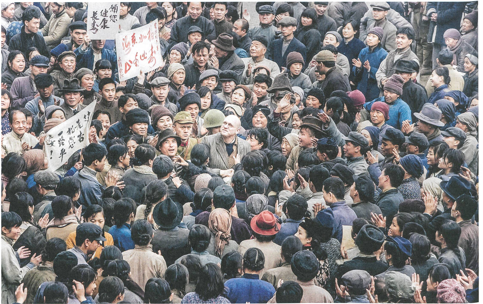
John Rabe (2009) mit Ulrich Tukur