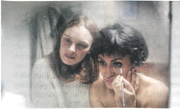
Jeune femme Regie: Léonor Serraille