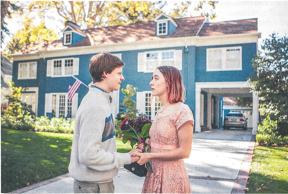
Lady Bird Regie: Greta Gerwig, mit Lucas Hedges und Saoirse Ronan