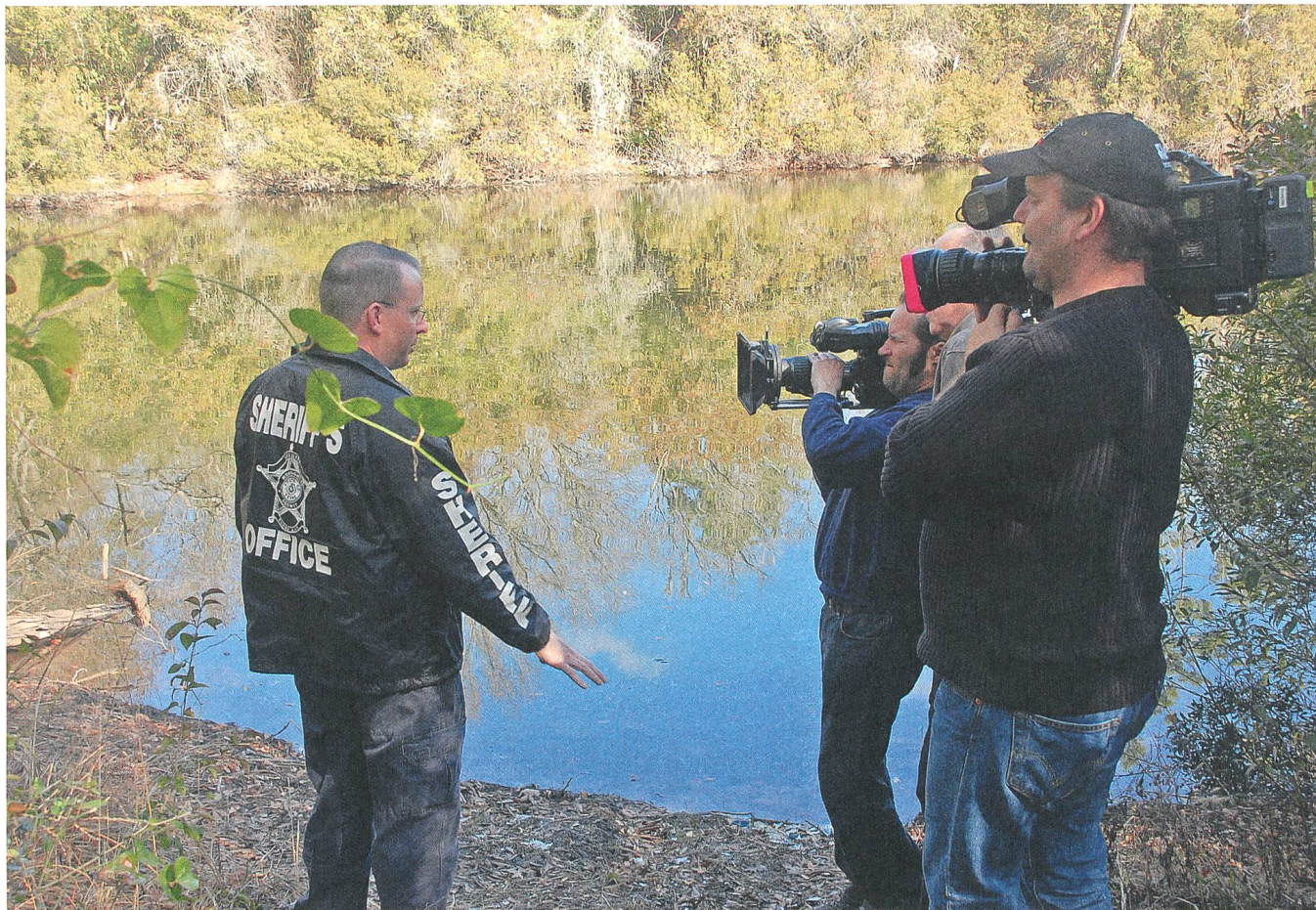
Bei den Dreharbeiten zu Werner Herzogs Dokumentarfilm 'Into the Abyss' (2011)

Verlag Filmbulletin Dienersstrasse 16 CH-8004 Zürich +41 52 226 05 55 info@filmbulletin.ch www.filmbulletin.ch