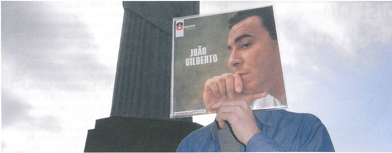
Wo bist Du, João Gilberto? Regie: Georges Gachot