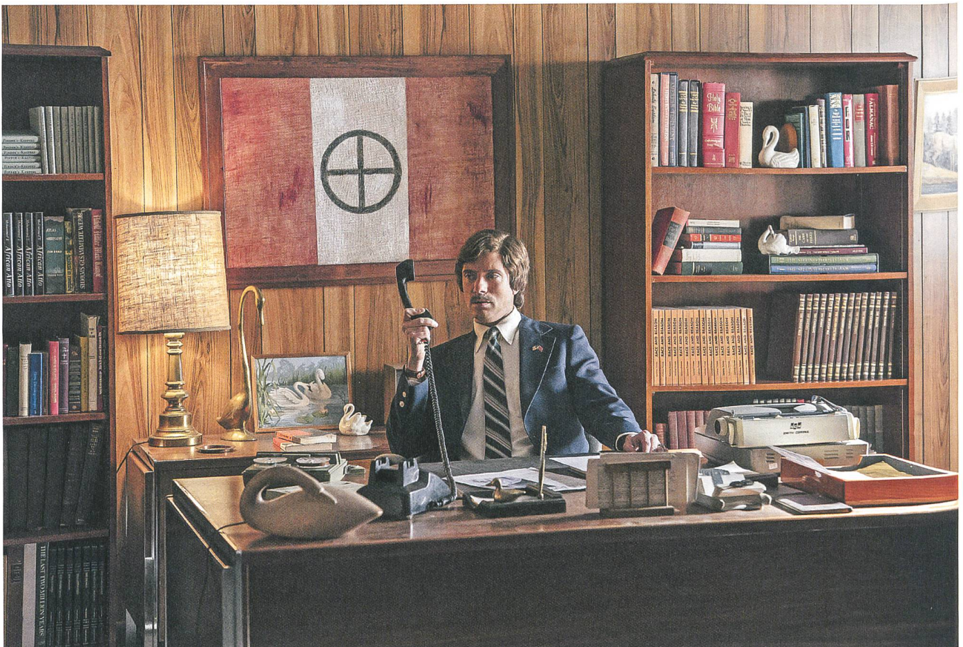
BlackKkKlansman Regie: Spike Lee, mit Topher Grace