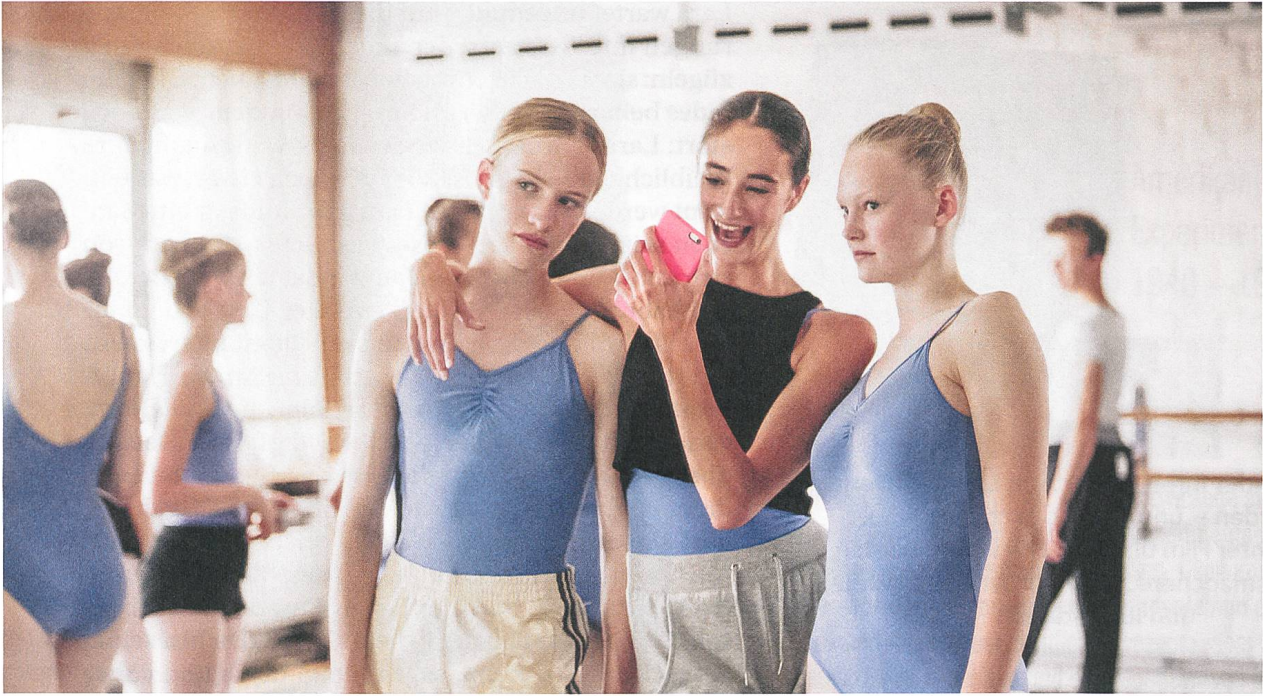
Girl Regie: Lukas Dhont