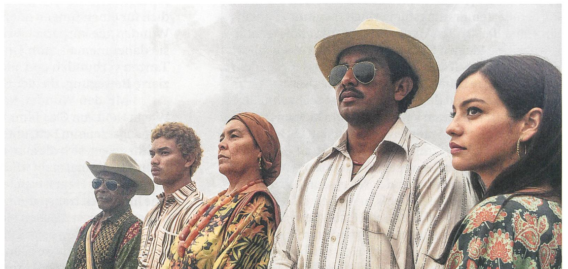
Birds of Passage Regie: Ciro Guerra, Cristina Gallego