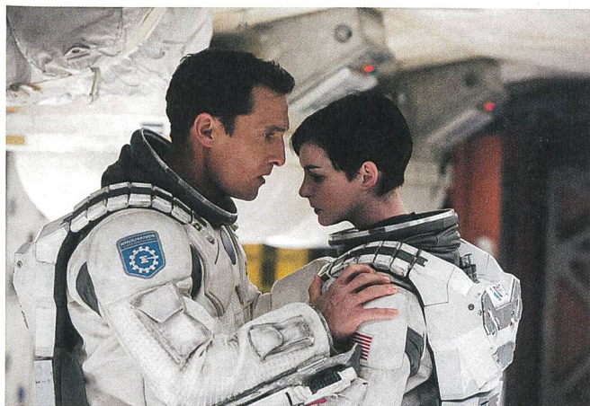
Interstellar (2014) Regie: Christopher Nolan