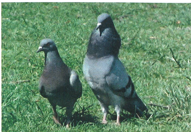
Les pigeons du square (1982) Regie: Jean Painlevé