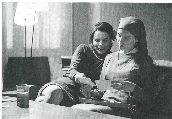
Ida (2013) Regie: Pawel Pawlikowski