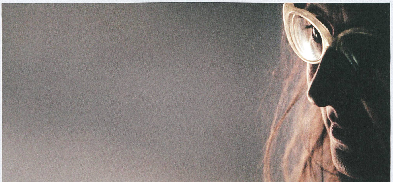
Años luz (2017) Regie: Manuel Abramovich