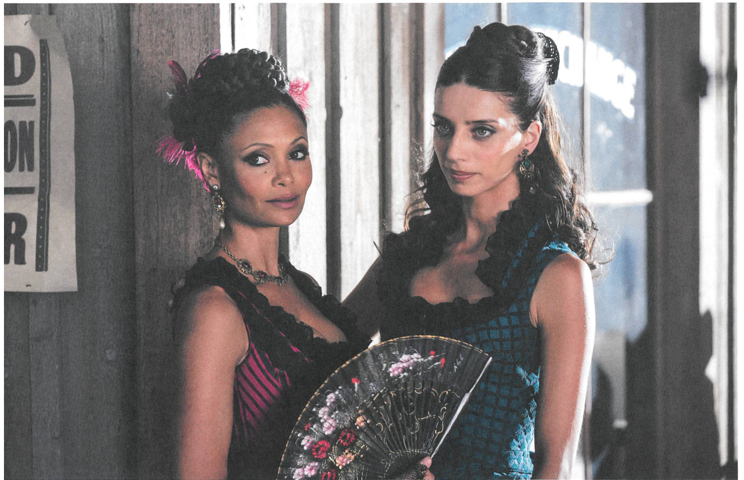
Westworld mit Thandie Newton, Angela Sarafyan