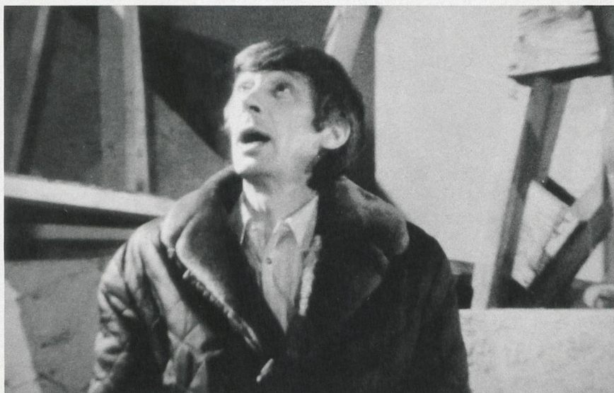
Die Selbstzerstörung des Walter Matthias Diggelmann (1973)

→ 9. Bildrausch Filmfest Basel (19. bis 23. Juni 2019) Bildrausch würdigt das Autor_innenduo Reni Mertens und Walter Marti mit einer Retrospektive.