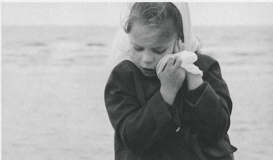
Ursula oder das unwerte Leben (1966)