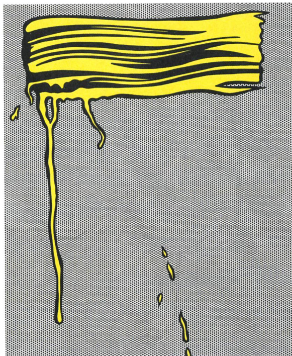
Roy Lichtenstein, Yellow Brushstroke , 1965, Kunsthaus Zürich, 1975 © Estate of Roy Lichtenstein / 2019, ProLitteris, Zürich