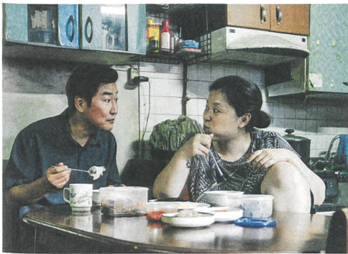
Parasite Regie: Bong Joon-ho