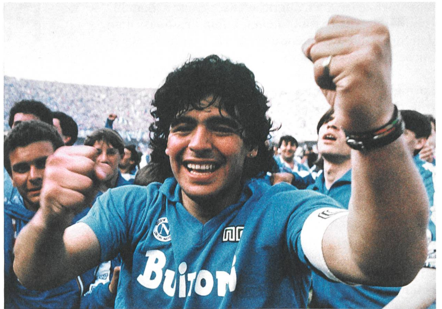
Diego Maradona Regie: Asif Kapadia