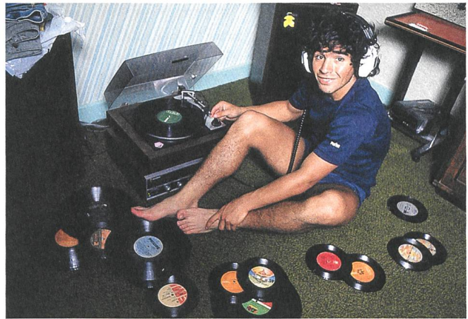
Diego Maradona