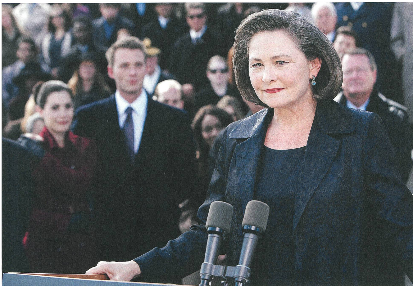
24 (Fox, 2001–2010) Cherry Jones als Präsidentin der USA