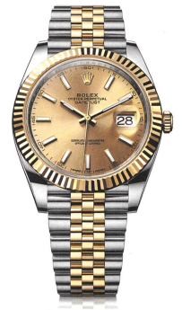
OYSTER PERPETUAL DATEJUST 41

EXKLUSIVER ZEITGEBER DER ACADEMY OF MOTION PICTURE ARTS AND SCIENCES