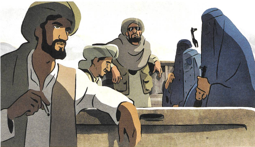
Les hirondelles de Kaboul Regie: Zabou Breitman, Eléa Gobbé-Mévellec