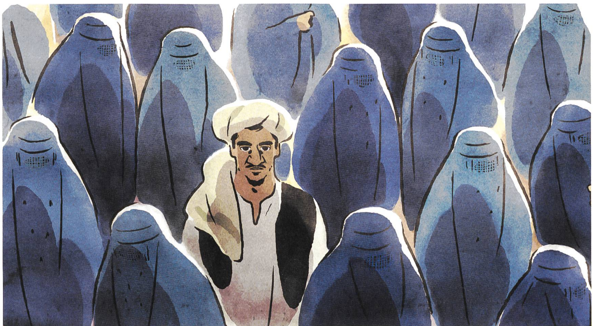
Les hirondelles de Kaboul Musik: Alexis Rault