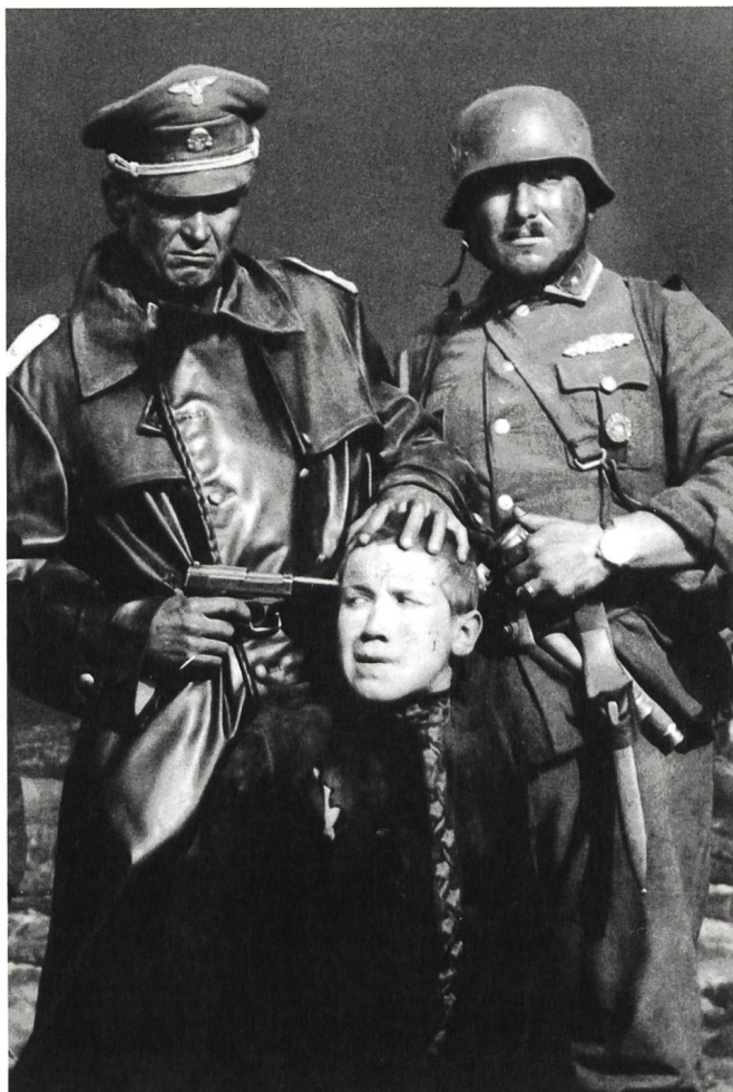
Idi i smotri (1985) Regie: Elem Klimow