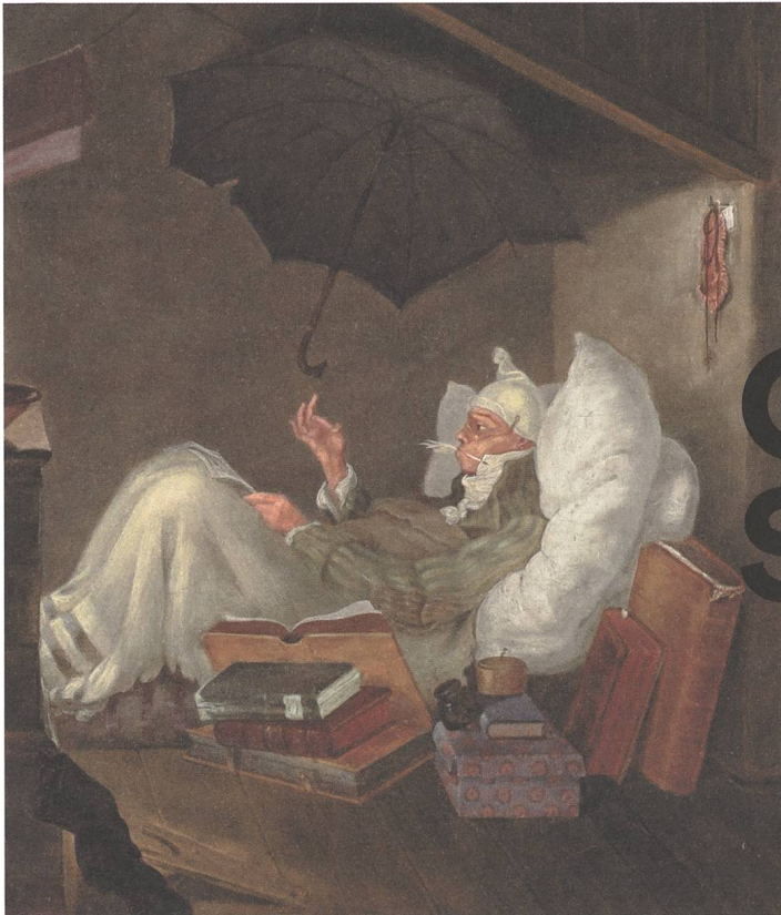
Carl Spitzweg, Der arme Poet (Detail), 1838, Privatbesitz