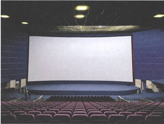
Kino Kyivska Rus, Kiew Ukraine