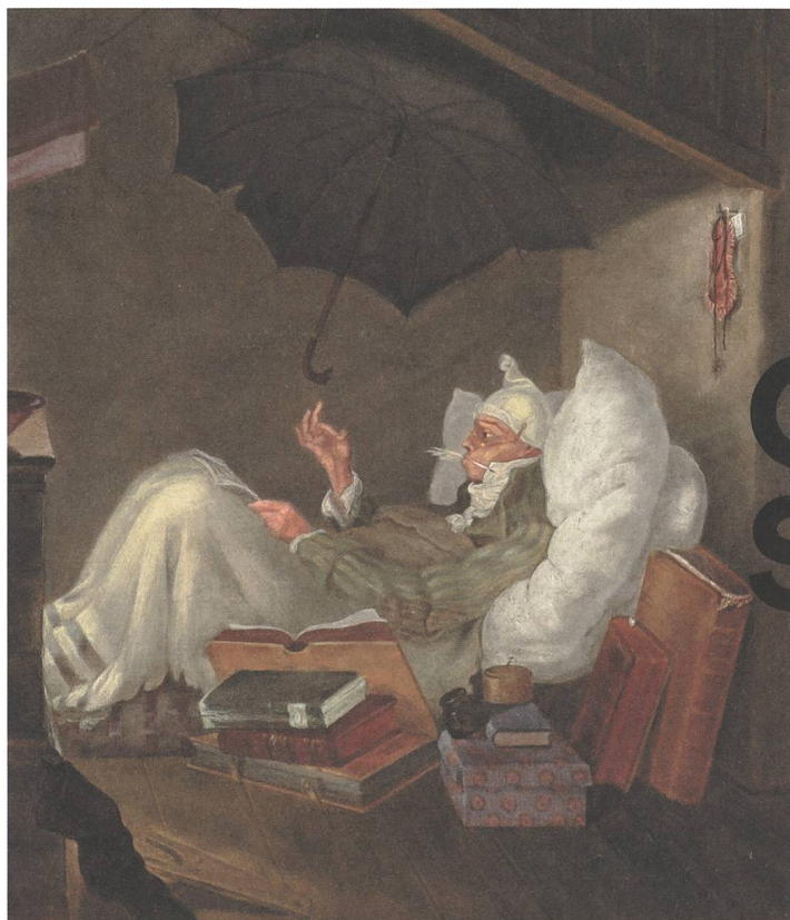
Carl Spitzweg, Der arme Poet (Detail), 1838, Privatbesitz

Kunst Museum Winterthur Reinhart am Stadtgarten