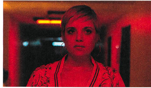
Berlin Alexanderplatz mit Jella Haase