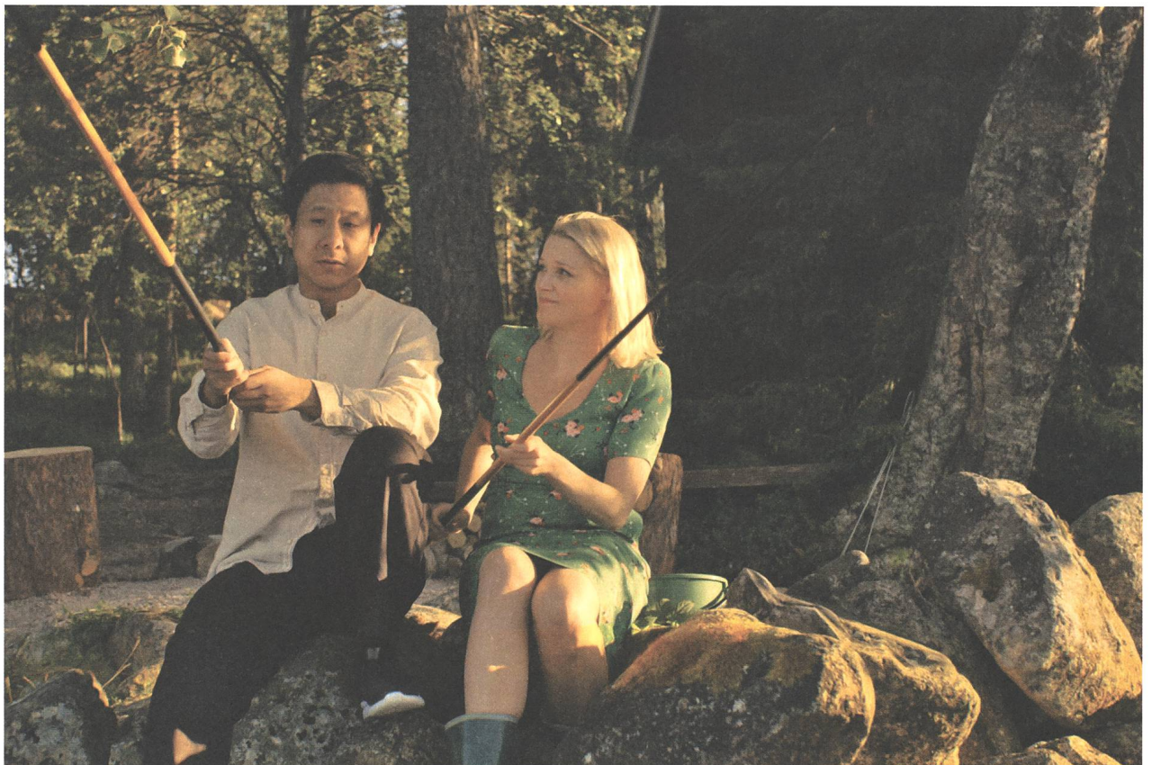
Master Cheng Regie: Mika Kaurismäki