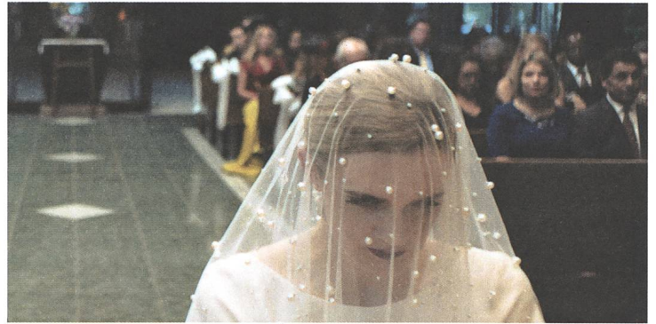
The Climb Kamera: Zach Kuperstein