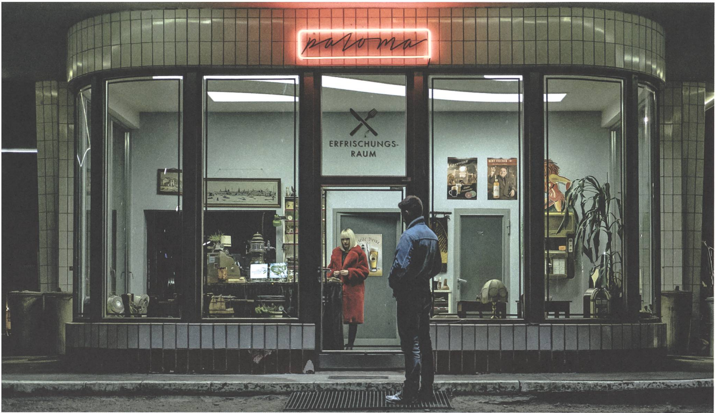
Cortex Regie: Moritz Bleibtreu