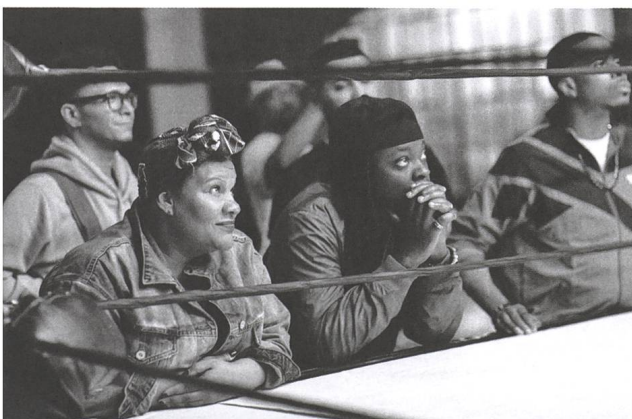
The Forty-Year-Old Version Regie: Radha Blank