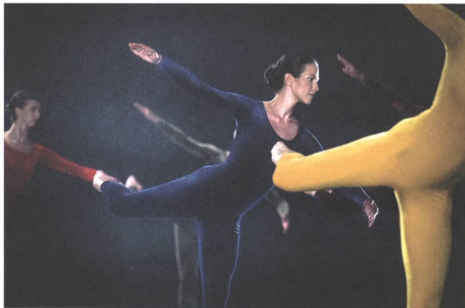
Cunningham Regie: Alla Kovgan