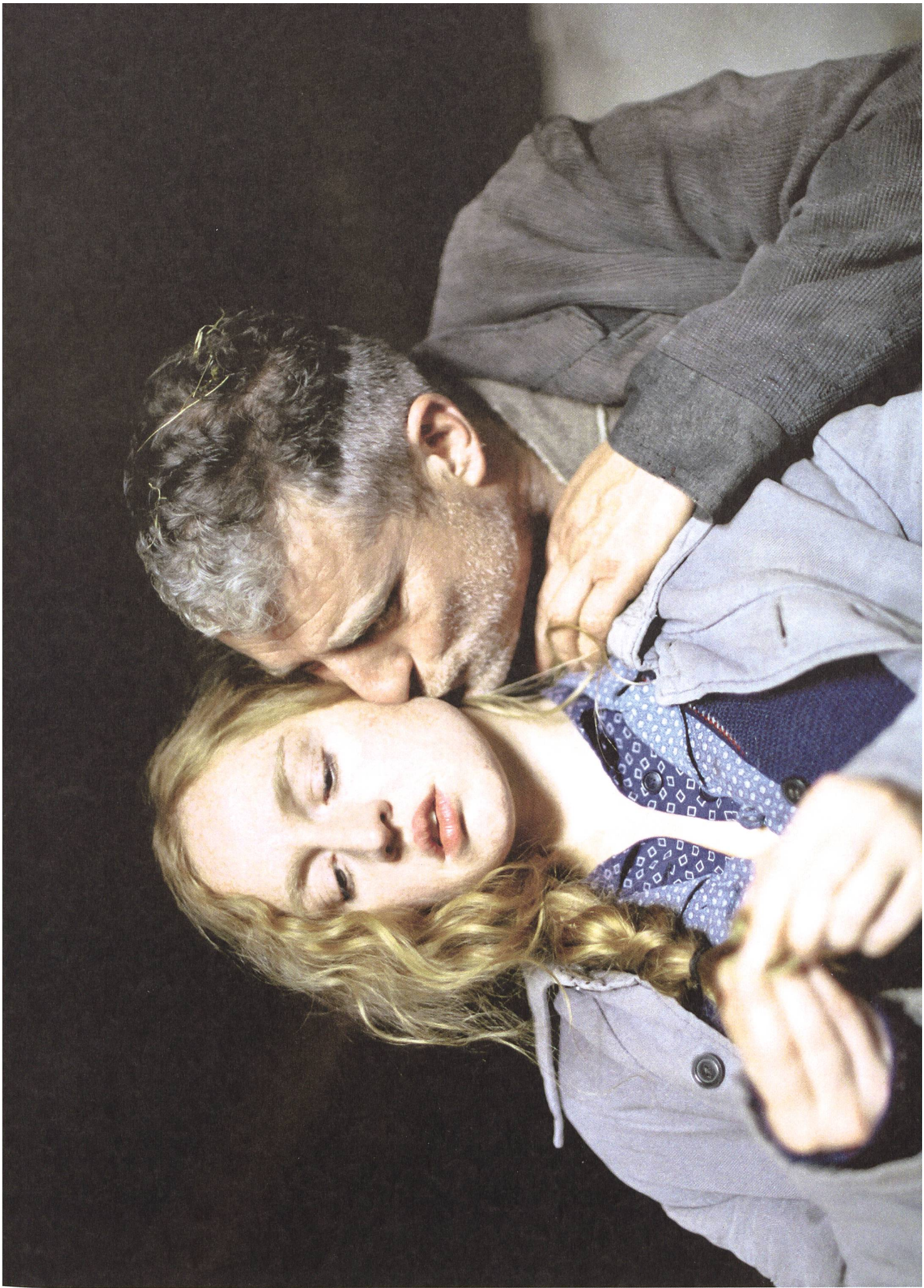
Tannöd (2009) Buch: Petra Lüschow, Bettina Oberli