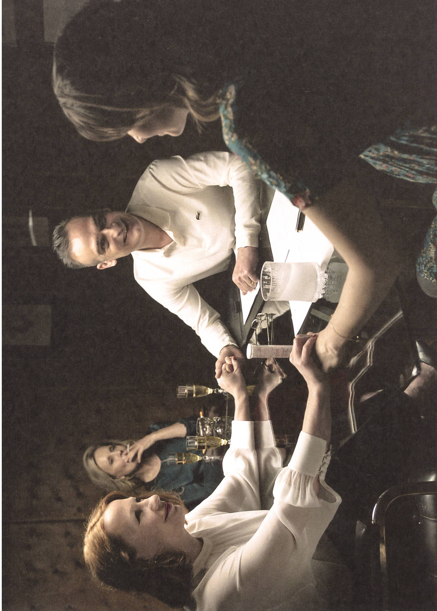
Wanda, mein Wunder (2020) Regie: Bettina Oberli