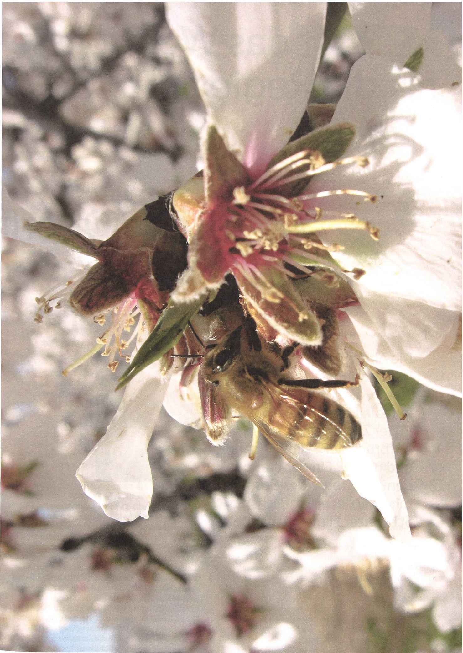
More than Honey (2012) Regie: Markus Imhoof