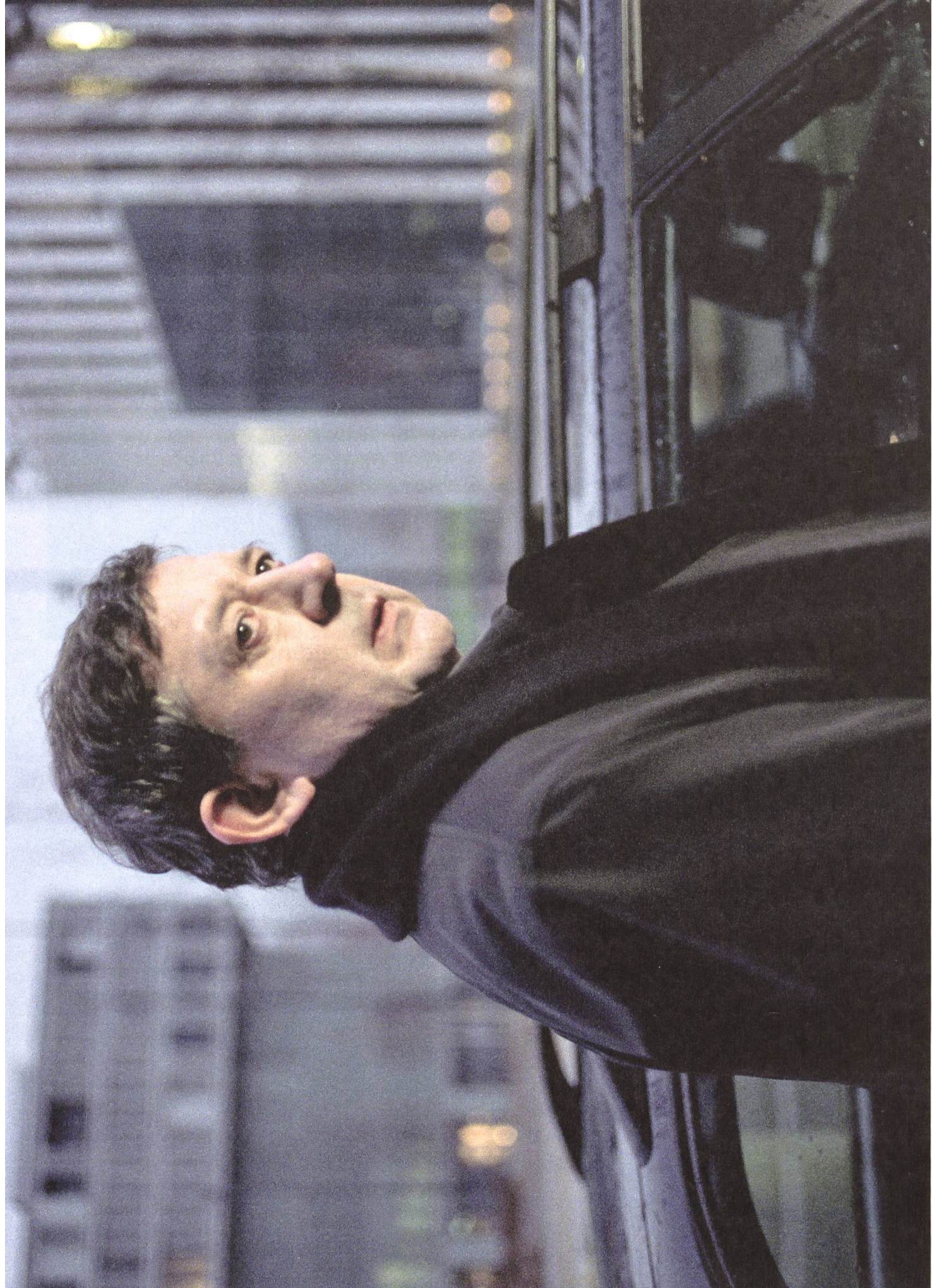
Tannöd (2009) Regie: Bettina Oberli