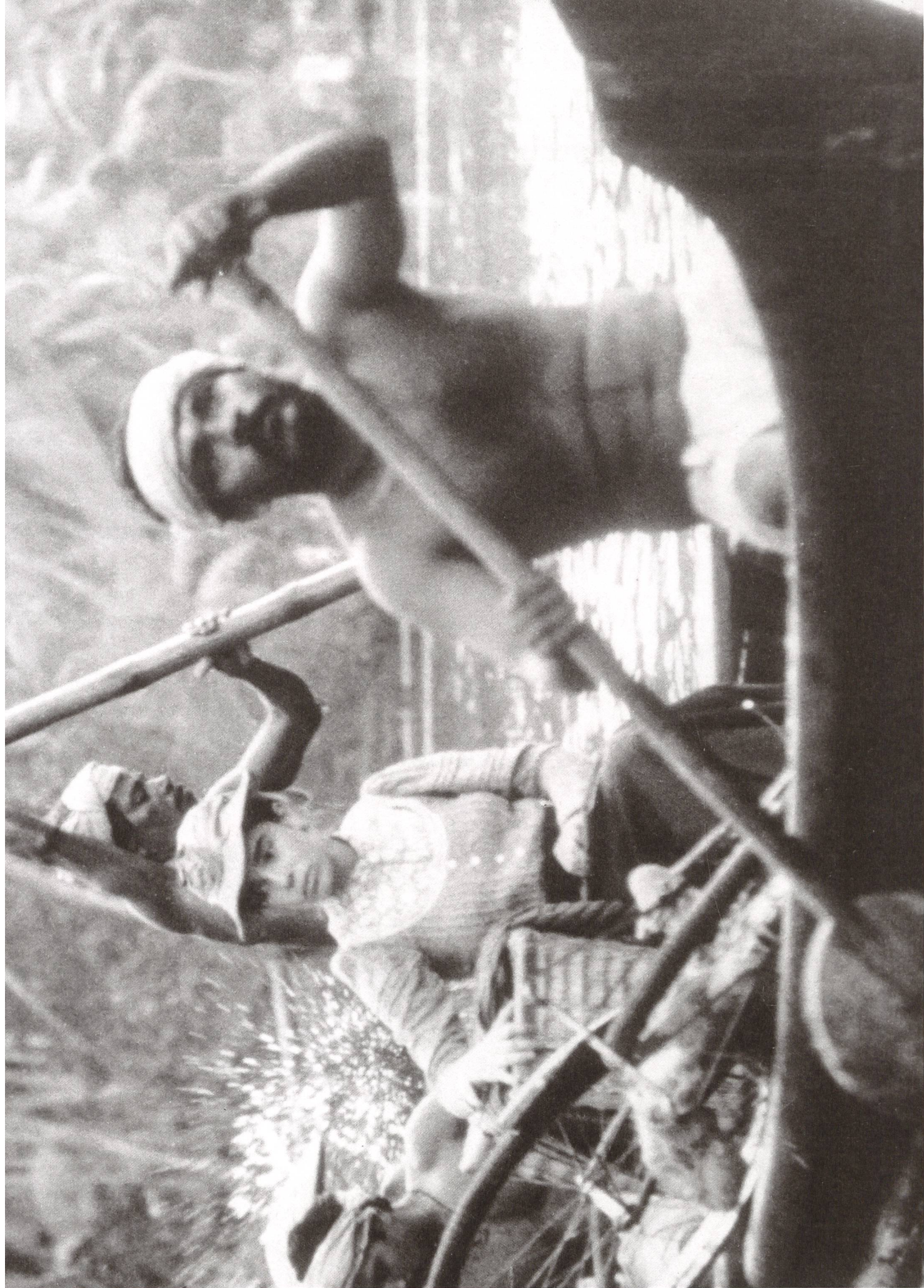
Flammen im Paradies (1997) Regie: Markus Imhoof