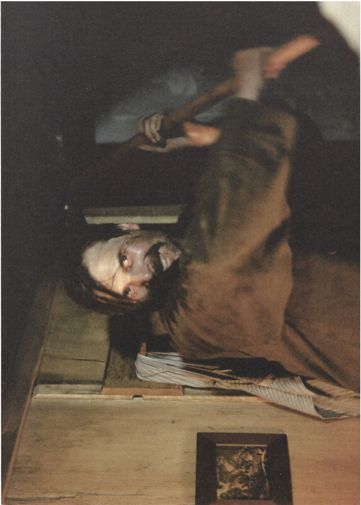
Der Berg (1990) Regie: Markus Imhoof