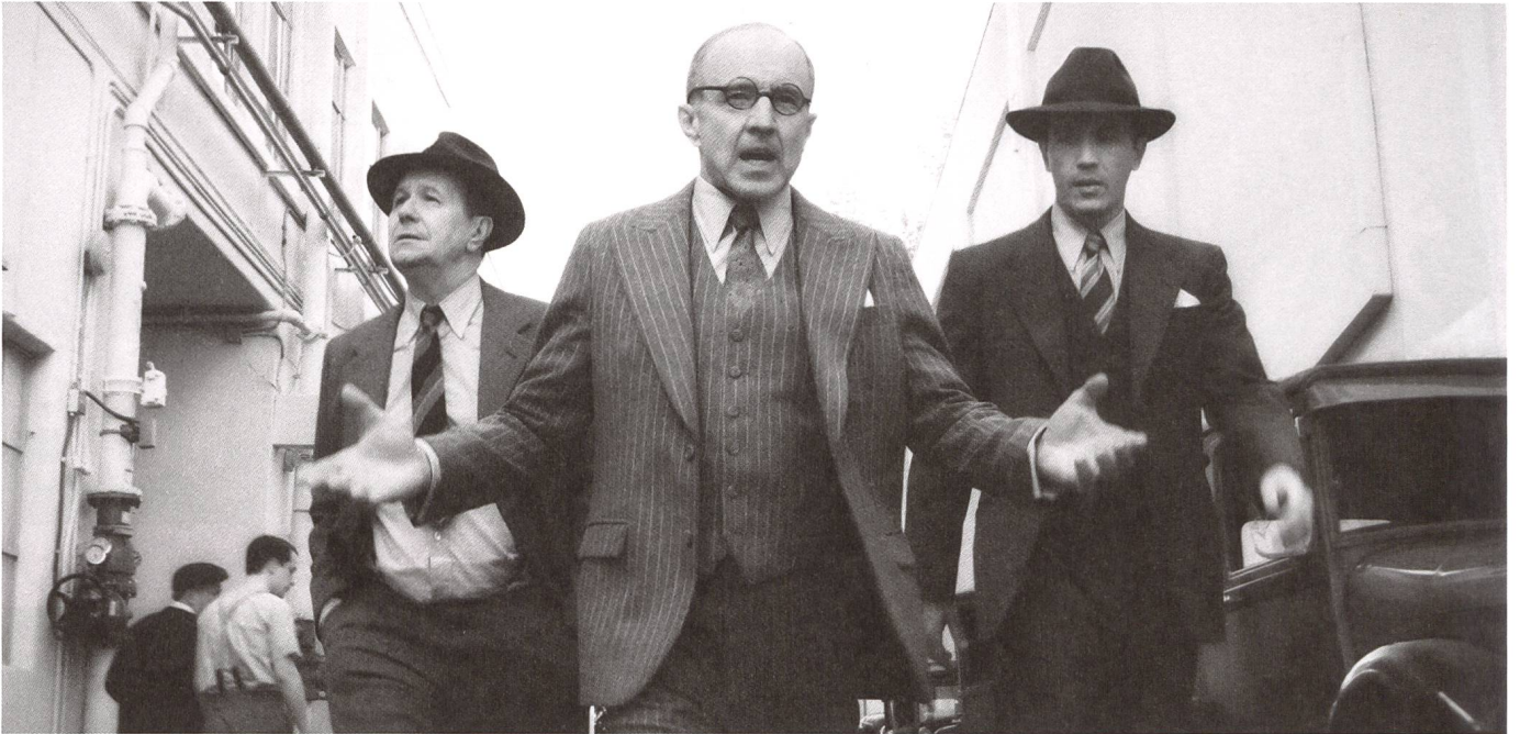
Mank Buch: Jack Fincher