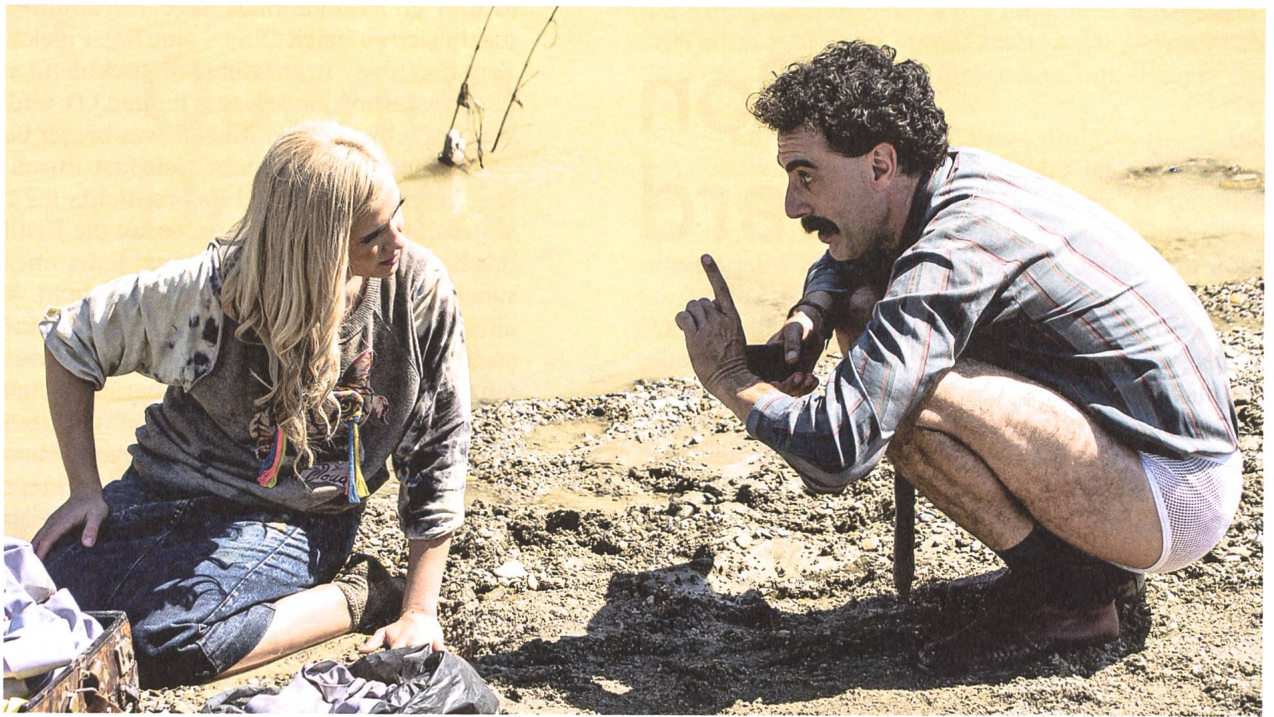
Borat Subsequent Moviefilm mit Maria Bakalova