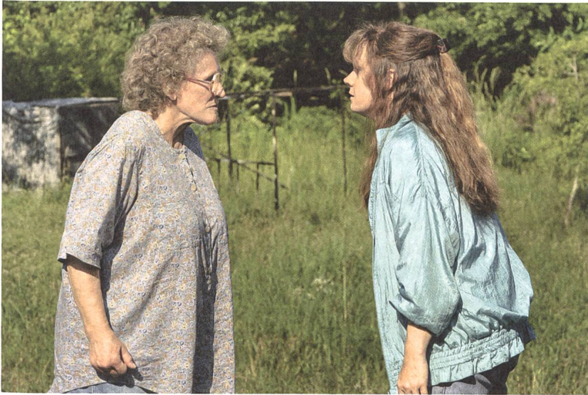
Hillbilly Elegy mit Glenn Close