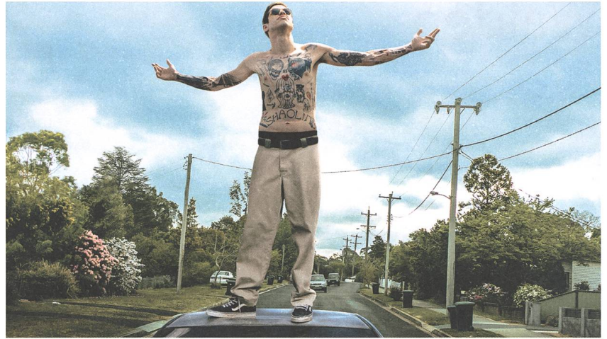
The King of Staten Island Regie: Judd Apatow