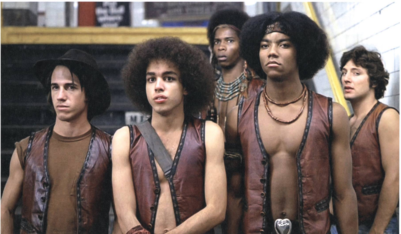
The Warriors 1979, Walter Hill

«Ich will neue Ideen an ein neues Publikum herantragen, so entstehen Dialog und Verständnis.»