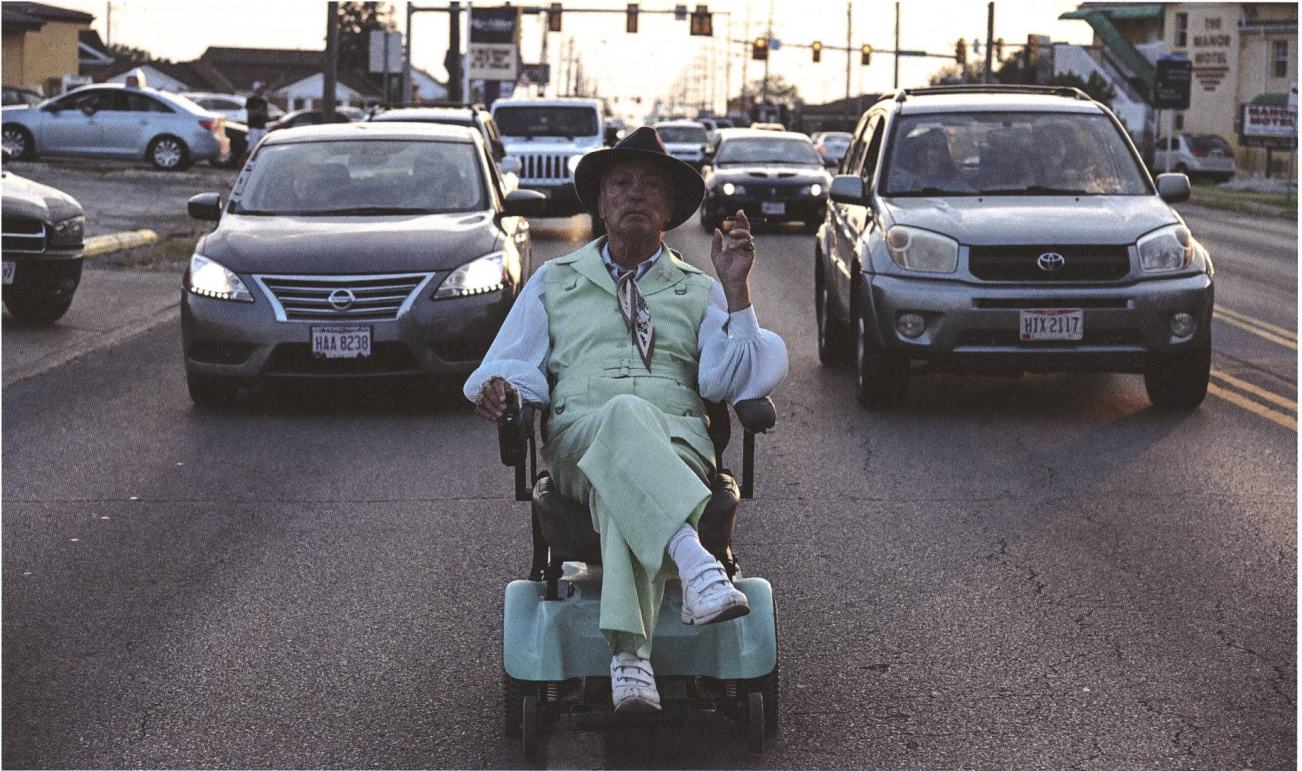
Swan Song 2021, Todd Stephens