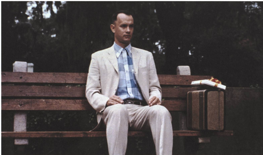
Forrest Gump 1994, Robert Zemeckis Ist die Gegenwart zu woke für diesen Film?

Laut Hanks war etwa seine Besetzung damals einer der Gründe, weshalb die Leute keine Angst vor Philadelphia hatten. Diese Zeit habe man nun aber hinter sich gelassen, und er glaubt nicht, dass das Publikum heute noch die unauthentische Darstellung eines Homosexuellen durch einen heterosexuellen Schauspieler akzeptieren würde. So berechtigt und wichtig das Ansinnen ist, so schnell kommt die Frage auf, wie absolut die Forderung verstanden werden soll und was sie in ihrer Konsequenz für den Schauspielberuf im Allgemeinen bedeutet. (mak)