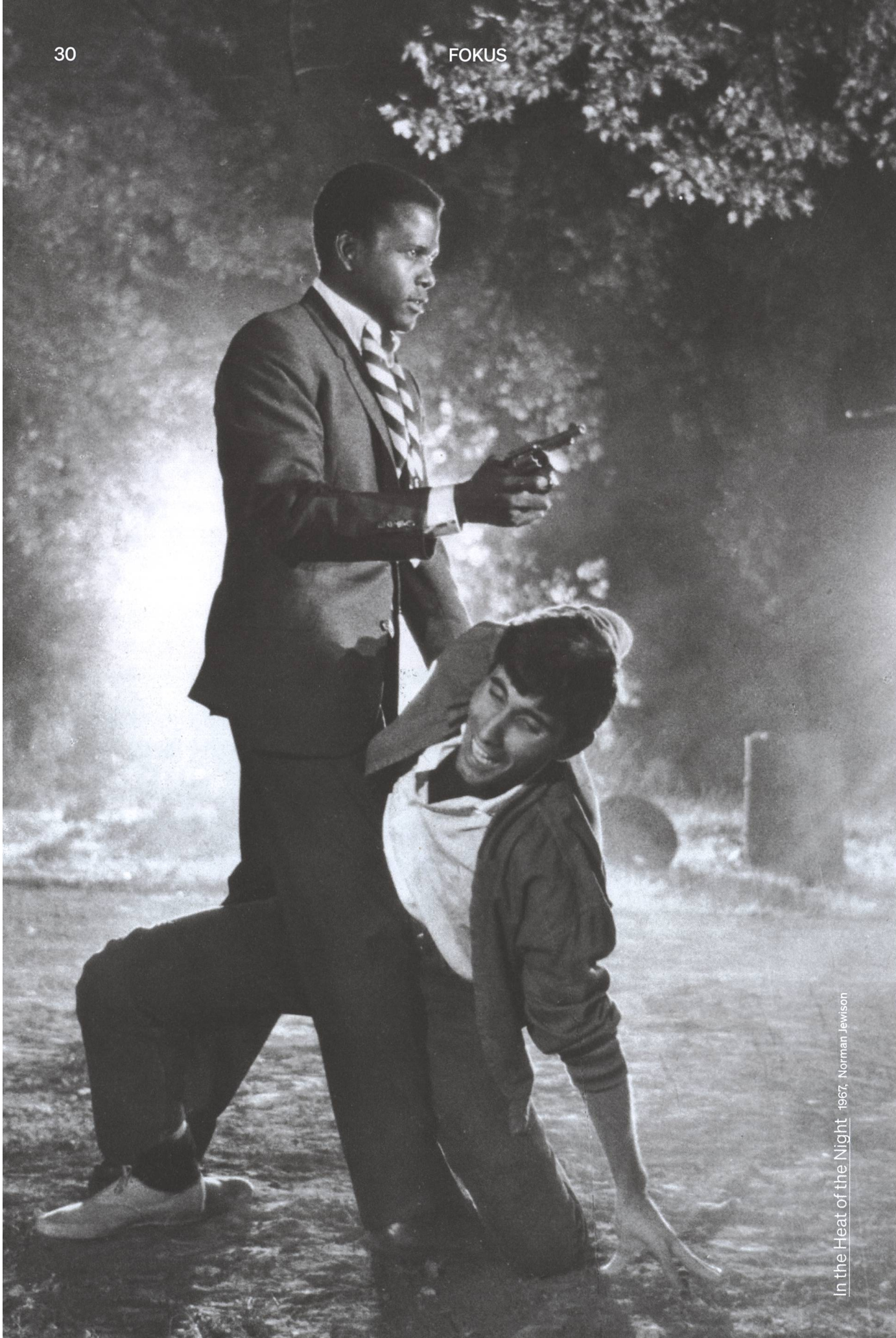
In the Heat of the Night 1967, Norman Jewison