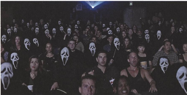
Scream 2 1997, Wes Craven

Damit verrät uns Scream 2 dann auch gleich selbst die Mechanismen Hollywoods. Die zeigen sich – denkt man genauer darüber nach – in den Sequels ohnehin oft am kenntlichsten: In den Film-im-Film übersetzt, sind die Figuren plötzlich schlanker, gebräunter, blonder als zuvor. Und die Attacke des Mörders auf die junge Frau findet nicht mehr in der Küche, sondern unter der Dusche statt, wobei sich das fiktionale Filmpublikum in Scream 2 über ein vom Körper gerutschtes