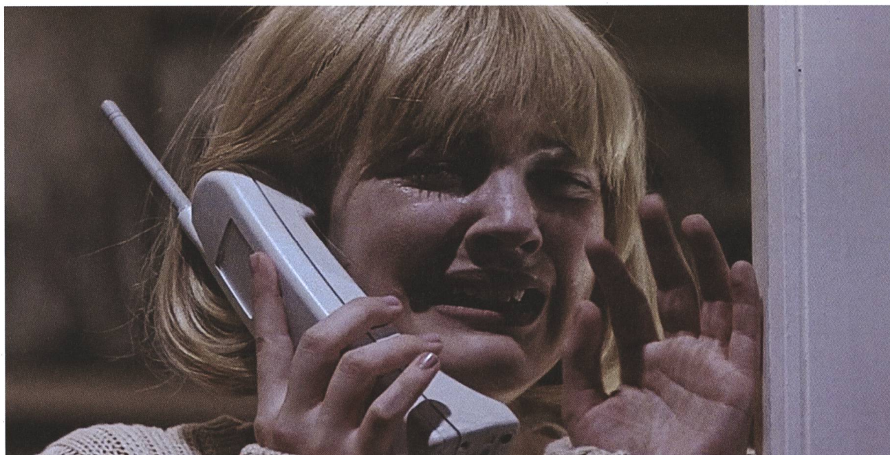
Scream 1996, Wes Craven

am kommenden 14. Dezember gemacht. Am Zurich Film Festival gab es Ende September darum nicht nur ein Modell des futuristischen Vehikels zu sehen, mit dem man in Avatar: The Way of Water unterwegs ist, sondern auch eine restaurierte 3D-Fassung des Originals von 2009. So ist man umso mehr gespannt, was James Cameron seinem futuristischen Sci-Fi-Epos noch anfügen könnte, bei dem viele schon 2009 den Verdacht hegten, dass es eher um das Experiment mit der digitalen 3D-Kamera ging als um die fadenscheinige Geschichte, die vielen wie ein Aufwärmen des Pocahontas-Mythos erschien und Cameron dementsprechend viel Kritik (aber eben auch drei Oscars) einbrachte.