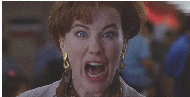
Home Alone 2: Lost in New York 1997, Chris Columbus