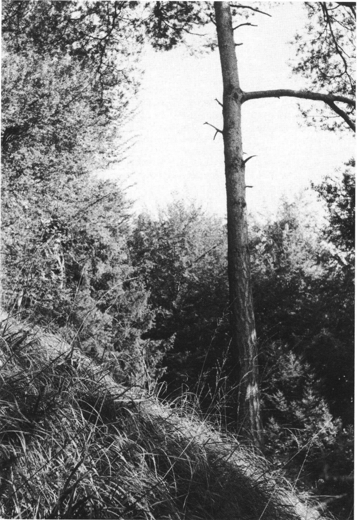
Abb. 2: Aufnahmefläche Nr. 2, unterhalb Chastelsberg. Pfeifengras dominierend unter lockerem Kiefernbestand. Anfang September 1984.