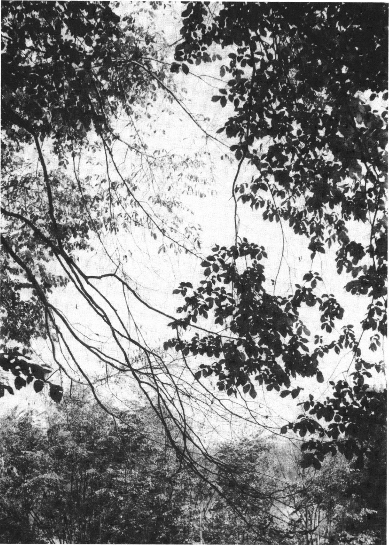
Abb. 1: Absterbende Ulme im Palatinat. Die unteren Zweige sind abgestorben, etwas oberhalb der Bildmitte sind die eingerollten, vertrockneten Blätter an den Zweigen geblieben, andere Zweige tragen noch grüne, manchmal auch vergilbende Blätter. Anfang September 1984.