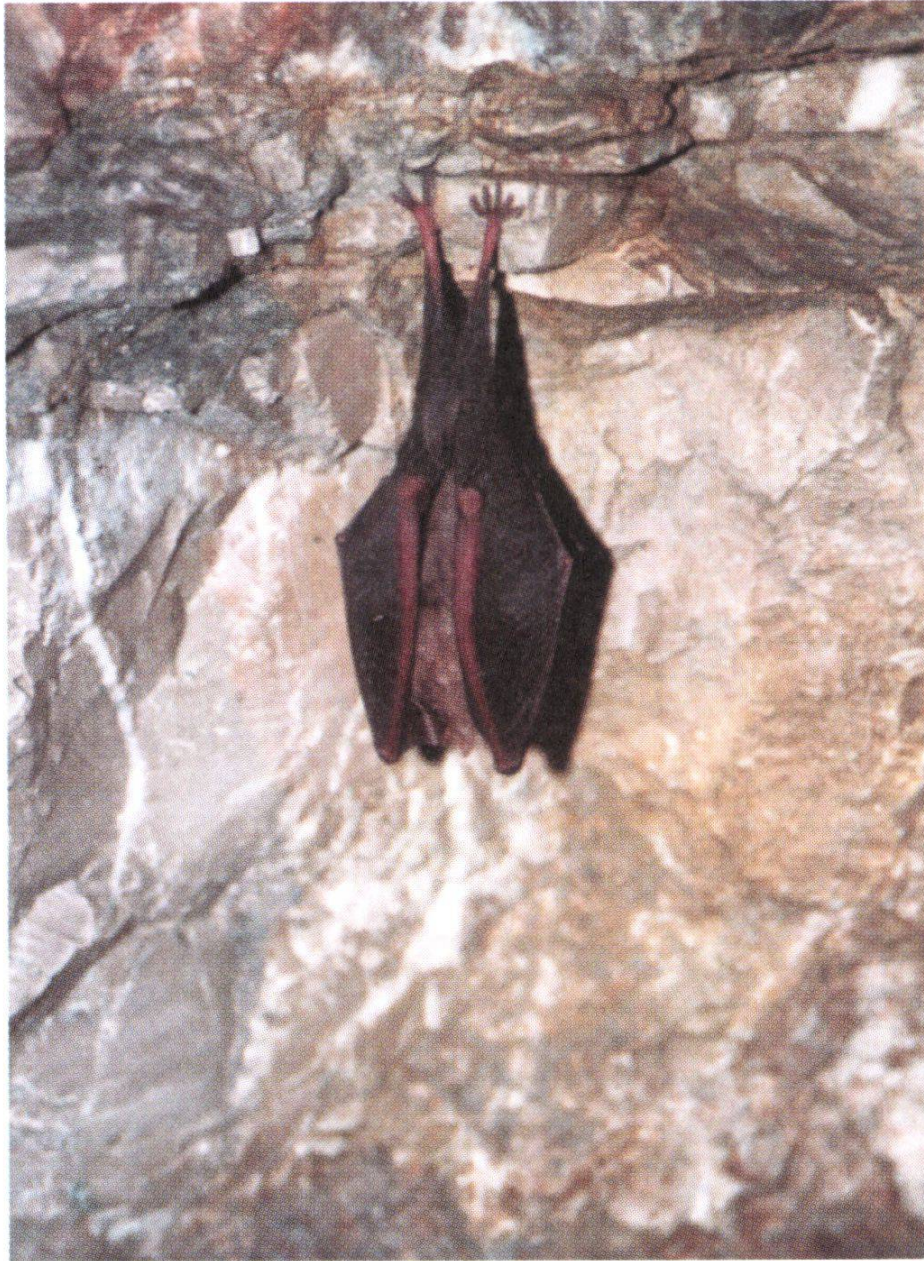
Figure 4 : Petit rhinolophe en hibernation.