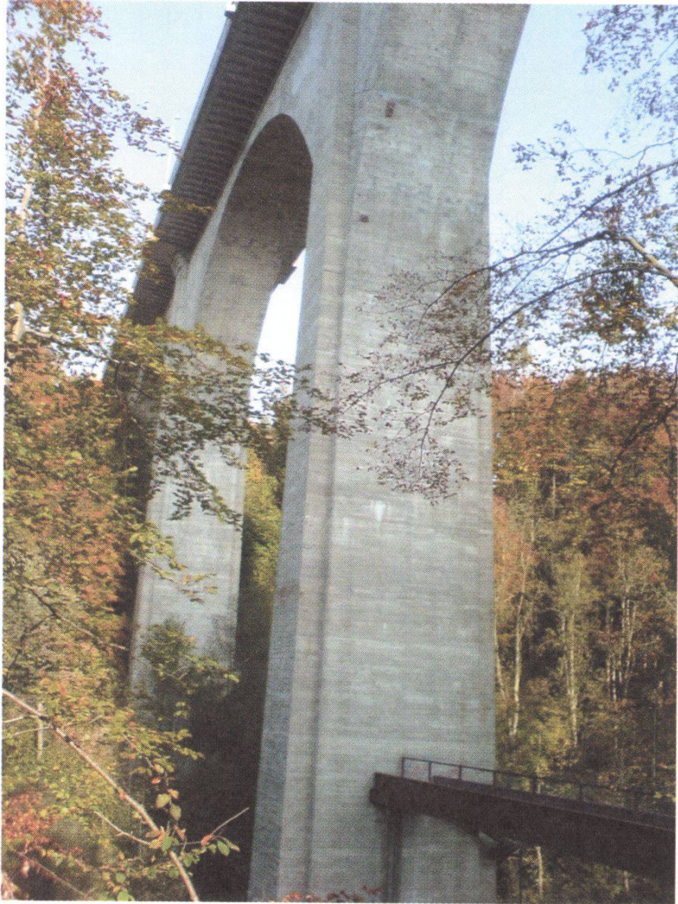
Figure 1 : Pont de Pérolles en 2006.