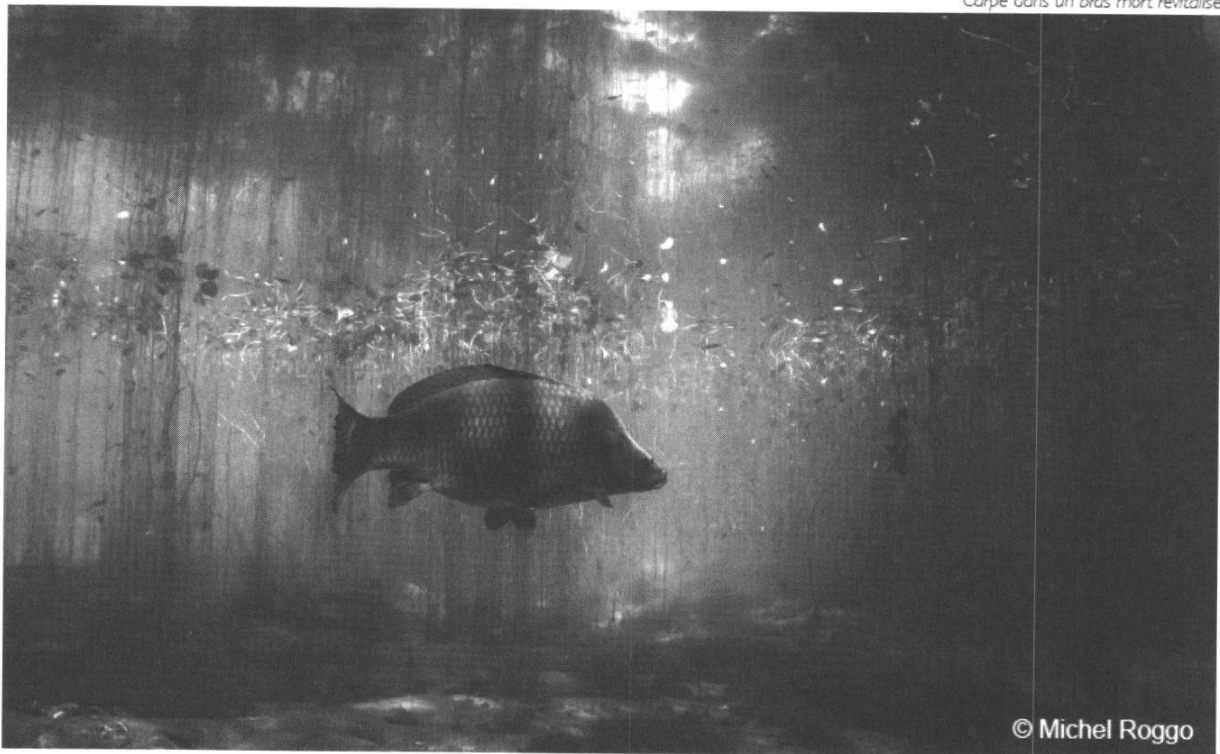
Carpe dans un bras mort revitalisé

Lors de sa conférence, Michel Roggo nous montrera d'abord ce qui peut arriver à un photographe pourtant expérimenté – comment par exemple une caméra finit dans la gueule d'un crocodile. En deuxième partie, il nous proposera un voyage magique, dans des univers subaquatiques époustouflants de richesses et de beauté, des Balkans au Canada, en passant par la Scandinavie et le canton de Fribourg. Des séquences d'images qui se passent de commentaires.