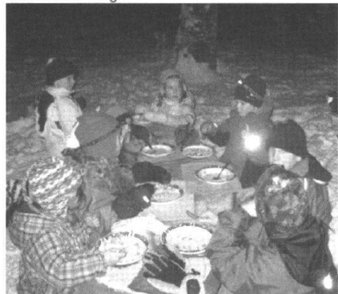
© Catherine Pfister, groupe Jeunes + Nature