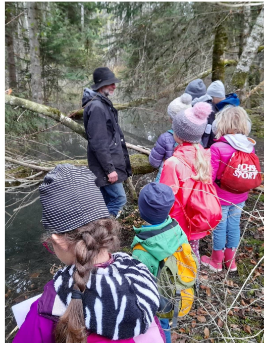
Observation des traces du castor lors de la sortie J+N de novembre à Planfayon

La 2 e saison de l'offre pédagogique de Pro Natura Fribourg Nature à la Carte s'est déroulée d'avril à septembre 2021. Destinée aux élèves de 8 à 12 ans, cette offre propose aux classes une immersion dans l'univers des chauves-souris et des amphibiens. En 2021, 90 élèves ont participé à ces sorties nature réalisées à proximité de leur école et guidées par des spécialistes. Reconduite en 2022, l'offre réalisée en partenariat avec le programme Culture & École de l'État de Fribourg peut être réservée directement depuis le Portail Pédagogique Fribourgeois Friportail ; avis aux enseignants intéressés !