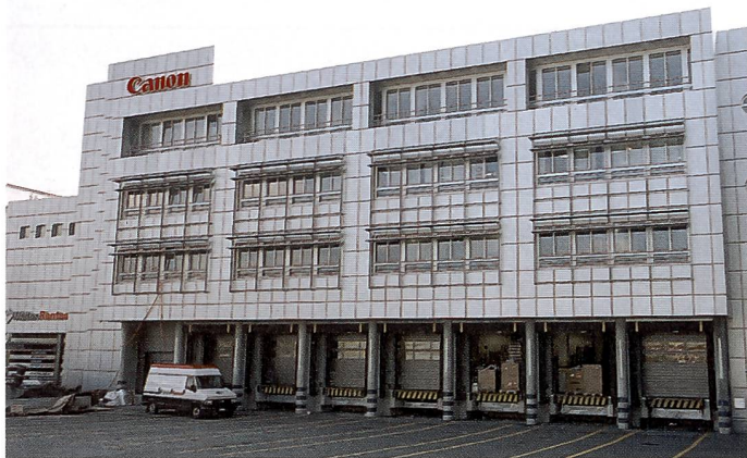
Das Logistikzentrum der Walter Rentsch Gruppe in Mägenwil ...