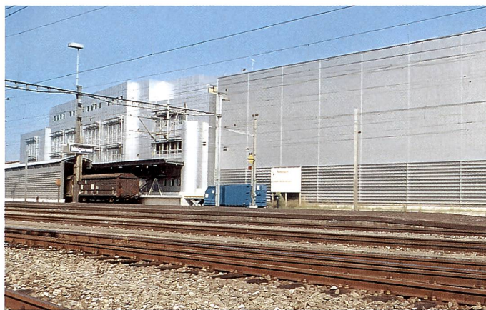
... liegt unmittelbar an der SBB-Linie Zürich-Bern

Maeder: Mit diesem Problem können wir umgehen, denn wir haben exakt dieselbe Situation im Bereich der Canon Bürogeräte. Wir lösen aber das Problem nicht damit, dass wir die Grossverteilern nicht beliefern. Wenn diese unbedingt ein bestimmtes Canon Produkt wollen, dann beschaffen sie es sich irgendwo anders.