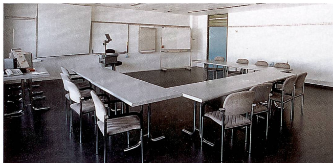
Ein Ziel der Umstrukturierung: Mehr Schulung für den Fachhandel in modernsten und gut eingerichteten Räumlichkeiten.

FOTOintern: Canon ist ja in einem sehr breiten Markt tätig, der von Kameras über Kopier- und Faxgeräte bis zu Computer-Peripherien reicht.