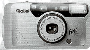
Rollei Prego Zoom (70) – die Kompakte für mehr Flexibilität