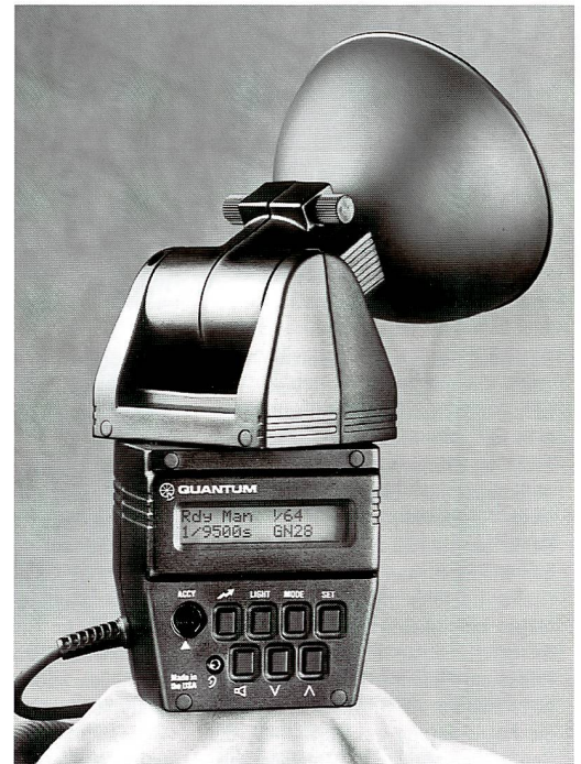
Das Quantum-Blitzgerät Qflash T kann dank seiner kompakten Bauweise sowohl auf der Kamera als auch extern auf einem Stativ benutzt werden. Dem vielfältigen Einsatz sind kaum Grenzen gesetzt.

lichkeiten im automatischen oder manuellen Betrieb ergeben.