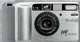
Rollei Prego Micron – die kleine, feine Leichte